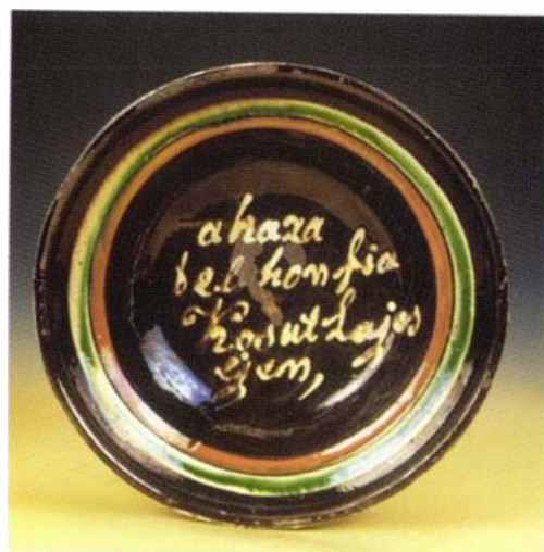
Feliratos tál, 1860-as évek. Lipppa, Temes megye. Népraizi Múzeum