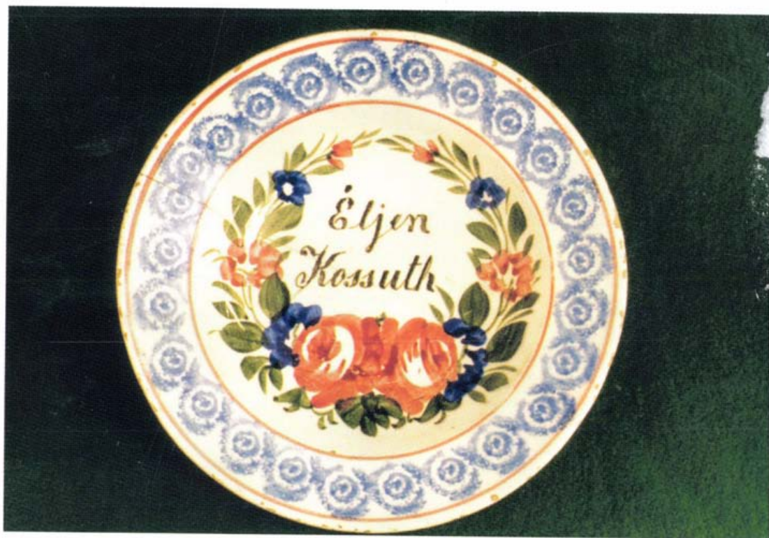
Díztányér, XIX. század vége. Iklad, Pest megye. Petőfi Múzeum, Aszód