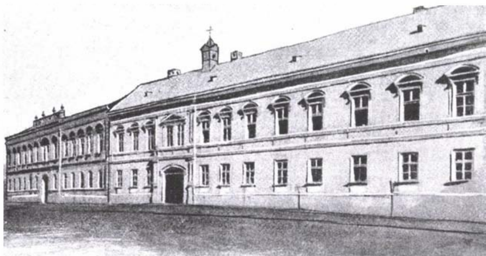
Belényes – a görög katolikus főgimnázium

Az intézeti és tanári igények kielégíthetlensége a gimnáziumot anyagilag nehéz helyzetbe hozta. A tengődést Pável Mihály püspöki kinevezése oldotta, aki mindjárt hivatalba lépése után a tanári kar tagjait a közeli lelkesedésekben alkalmazta, hogy parókiájuk jövedelmével szaporíthassa szerény fizetésüket. Ezt bármely püspök megtehetette volna a maga hatáskörében. De az egyháznagyok számára más követendő, de nem követett példát is állított, lemondva díszes állásával járó igények legtöbbször, uradalmi jövedelmének egy részét népének, s híveinek javára takarította meg. Egyben módot adott a tanári kar szinte minden egyes tagjának arra, hogy a tanári képesítővizsgákat letegye. Tanári nyugdíjalapot létesített. A főgimnázium épületét saját költségén rendbe hozatta, bővítette és a kellő felszereléssel ellátta.