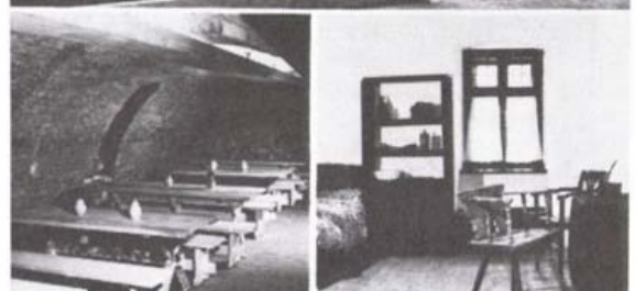
Szalkszentmárton, Petőfi Sándor Emlékmúzeum