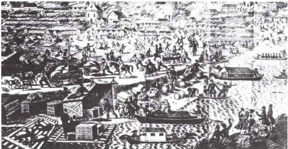
Baja látképe egy 1820 után készült metszeten

Kalocsáról Bajára tartva útba esik Érsekcsanád . Szép, népművészetéről – főleg viseletéről – híres község. 1862–1866 között itt volt református lelkész Baksay Sándor író, költő, műfordító, református püspök, akiről Kunszentmiklósnál szoltam bővebben. Emlékét sajnos semmi nem őrzi a faluban.