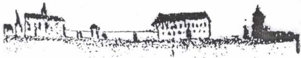
A gyulafehérvári Szent Mihály utca északi házsorának részlete 1711-ben. Jezsuita kolostor, a Collegium Academicum és a Szent György kapu. (Visconti rajza alapján)

démiai rangra emeli. 1 A hagyományos felfogás ezt a dátumot tekinti az iskola keletkezési évének. A kezdetekhez azonban feltétlenül hozzátartozik, hogy már évszázadokkal 1622 előtt is, működött egy káptalani iskola a fejedelmi székhelyen. A katolikus iskola fénykora, a XV. és XVI. századra esik. A reformáció hatására, 1550-ben kezdődik ugyanazon iskola protestáns időszeke, amely 1622-ben, a már említett rangraemeléssel jár. Az kétségtelen, hogy ez minőségi változásokat hoz, hiszen a Kollégium nemcsak új, magasabb iskolát, hanem önkormányzati, tanügyi és fegyelmzési jogokat és kiváltságokat is nyer, és így országos intézménnyé válik. 2 „Ha elfogadjuk a történelmi folytonosság kérdését, akkor azt mondhatjuk, hogy közös töröl fakadt a ma is működő két oktatási intézmény, a gyulafehérvári katolikus és a nagyenyedi, jelenleg még állami, egy református szeminárium tagozattal rendelkező Bethlen Gábor Kollégium.” 3