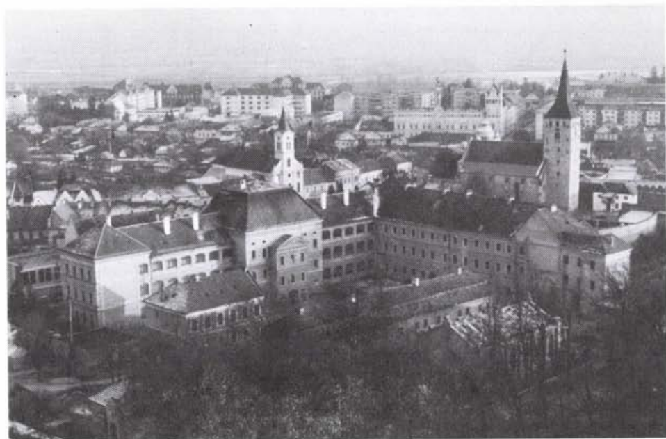
A mai kollégium látképe az Órhegyről