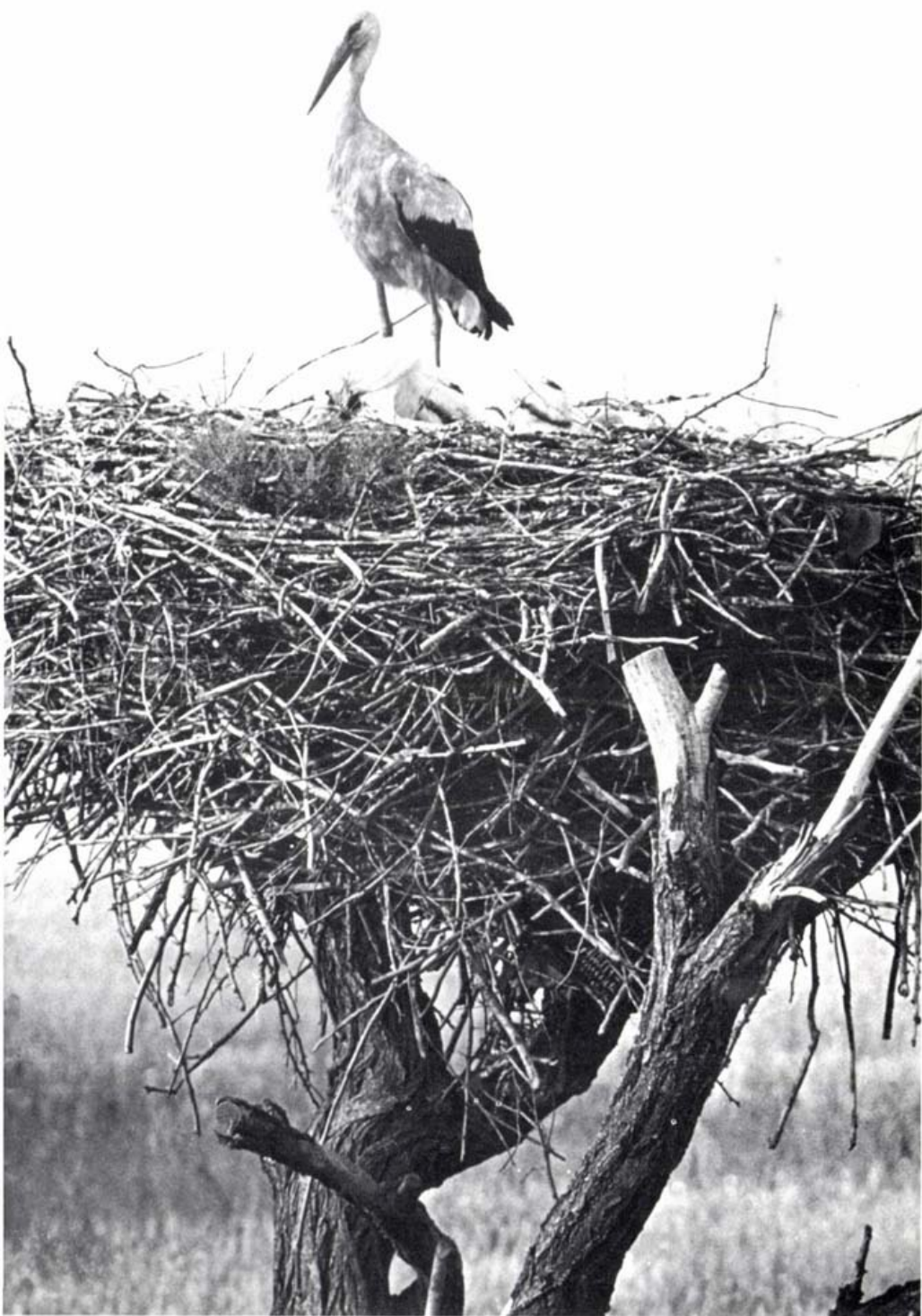
Gólya, fiaival