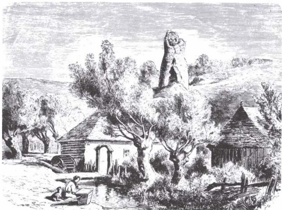
Ika várának zömtornya (Orbán Balázs: Székelyföld leírása III. 95.)

nemességért folyamodva hangoztatják: „...a mi eleinknek kővára lévén Udvarhelyszéken, amely hivattaték Firtos várának, ... melynek még mostan is kőfalai fennállnak, melyhez voltak faluk is,...ma is a várkapu előtt egy nagy kaszáló helyet mi bírunk...” (SzOkl. VII. 91. old.). Ha a köztudatban ekkor is az élt volna, hogy a székelység nem épített várat, egy ilyen passzust nem foglalhattak volna bele az oklevélbe. Nem sokra megyünk Szamosközy székelyekről írt jellemzésével: „...a székelyek...semmi vagy kevés gondot fordítanak a tisztességes tudományok tanulására, városaik vagy kerített helyeik nincsenek, az egész nemzet pásztorkodik, kunyhóik sárral tapasztott sövényekből állanak, szalmával vagy sással befedve...Bárdolatlan bolondságból azt hiszik, hogy gyávaság kőfalak közé zárni magát, azért is a szomszéd szászokat féltékenységgel vádolják...” 10 A leírás túlságosan elfogult, egyértelműen tükrözi a szerzőnek a székelyekkel szembeni ellenszenvét. A XVI–XVII. század fordulóján Háromszékben már szép számban állnak a templomerősségek, sőt már elkezdődik a második generációs templomerődök felépítése is (lásd Göngyössy i.h. ). A magát kőfalak mögé záró szászok „kőfalai” mögött valójában a szász városok falai rejlenek, a székely büszkeség csendül ki ebből a passzusból, aki gyávaságnak tartotta az életét falak között tengetni, mint a szász városok lakossága (persze végveszély esetén ő is bemenekült a templomok falai mögé).