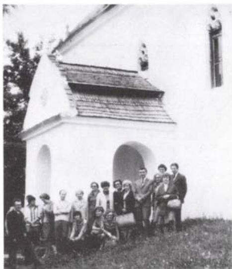
Kolozs megye magyar szakos tanárainak egy csoportja a szováti unitárius műemlék templom déli bejárata előtt. A templomot a benne levő címeres kő szerint a nemes Zsuky család építette.