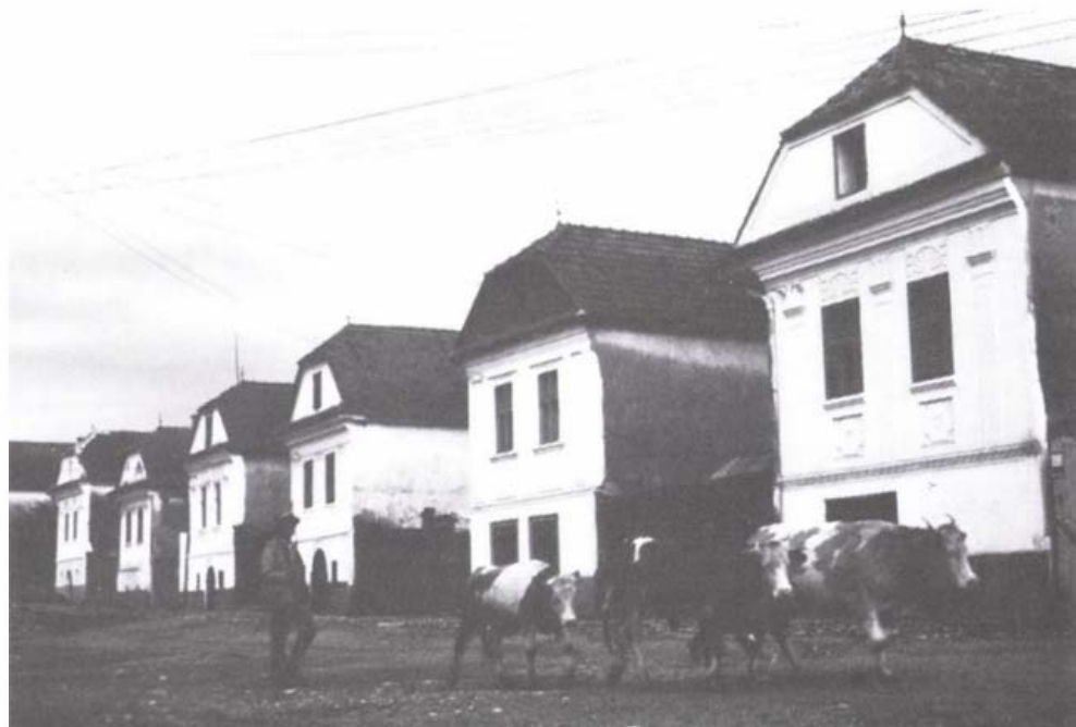
Torockói utcarészlet

Érdekes a két, egymás mellett lévő, igen eltérő földtani képződmény kontrasztja; ugyanis a kétféle kőzet színe, térszíni alakzatai, külső, mállasztó tényezőkkel szemben tanúsított ellenállása, viselkedése igen eltérő, s ezt még csak növeli az is, hogy míg a mészkőszirt hatalmas üregekkel, barlangokkal tarkított, meredek falai most árnyékban vannak, addig a szürkés-barnás-feketés vulkanikus sziklákat bearanyozza a délutáni nap. Mindez együtt sajátos, érdekes hangulatot ad a tájnak. Ebben a szélről védett melegebb és nedves völgyben évszázados vackor- és galagonyafák (igen: fák és nem bokrok) tenyésznek. Ezek minden bizonnyal már a torockói vaskőbányászat és vasközműipar virágzása idején is virultak.