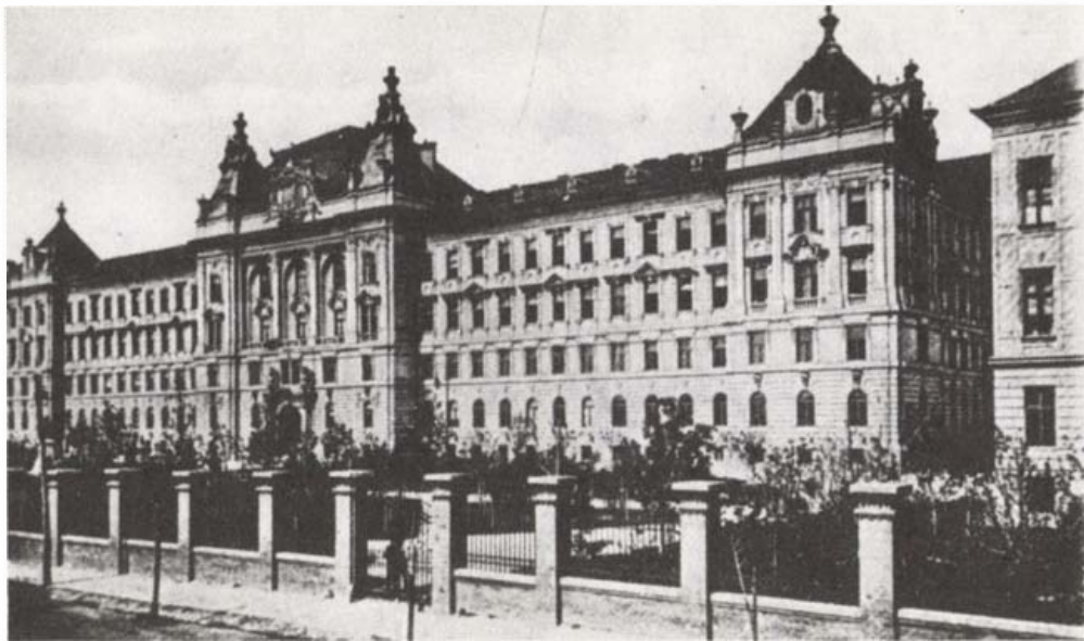
A Magyar Királyi Honvéd-Hadapródiskola, Pécs

Utóbb az egyetemi tanács minden energiáját arra fordította, hogy a felsőoktatási intézményt a Dunántúlon helyezték el. Csak két város jöhetett számításba: Győr és Pécs. Mindkettő mellett számos érvet lehetett felhozni, amelyeket az egyetem vezetősége pontosan mérlegelt is. Így megállapította, hogy Győr közelsége Pozsonyhoz biztosítaná azt, hogy ott a pozsonyi egyetem a maga sajátos hivatását teljesíthetné, azaz kulturális hatáskörébe vonhatja a Felvidéket és a Dunántúlt. Győr ugyan fejlődő város, számos kulturális intézménnyel rendelkezik, de kevés közkórházainak száma, ez viszont nehezíti az orvostudományi kar elhelyezését. Pécs ipari, gazdasági és művelődési szempontból a legkiemelkedőbb a Dunántúl összes városai között. A kórházak száma és minősége tekintetében pedig egyedül áll és ezeket némi átalakítással rövid időn belül fel lehet használni egyetemi klinikáknak. Van püspöki jogliceuma is, amely megteremtette és fenntartotta a főiskolai élet hagyományait a városban, és amelyet szintén be lehet kapcsolni majd az egyetem jog- és államtudományi karába. 5