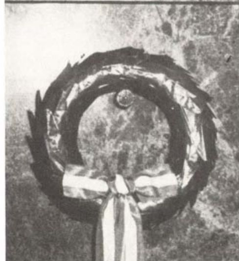
A Bláthy Ottó Ipari Szakmunkásképző Intézet földszinti folyosóján lévő dombormű Brém Ferenc, tatabányai szobrászművész alkotása. Felavatták 1987 szeptemberében, az iskola névadó ünnepségén