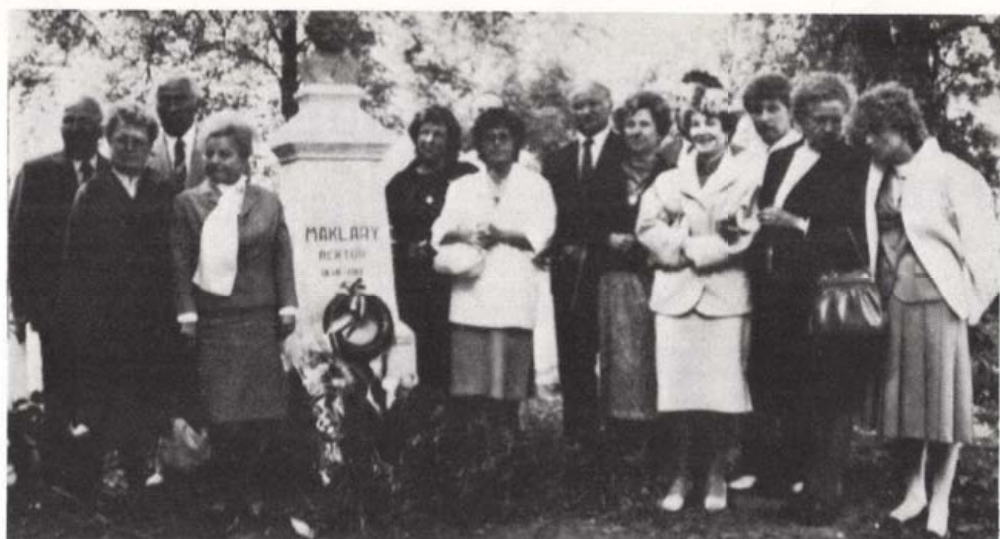
Maklárly utódok a restaurált szobor leleplezésén

reti szakkörünk. Azóta 54 TIT-előadást hallgattunk meg, s több alkalommal mentünk autóbuzos kirándulásra is.