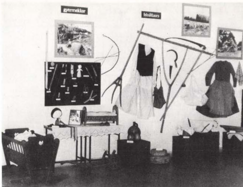
Részlet a kiállításból

női és férfiviselet révén adott élő képet a századeleji helybeli öltözködési kultúráról, divatról: a lányok színpompás ünnepi öltözékétől a menyecskeviseleten át a férfiak mértéktartó ruházatáig. A hagyományos gazdálkodási és háztartási tárgyak visszakalauzoltak bennünket a hajdanvolt hétköznapokhoz. Az állattartás, a szőlőművelés, a kőfejtés illetve a főzés, mosás, kenderfeldolgozás eszközei az egyaránt sok fáradtsággal járó férfi és női munka emlékét idézték fel. Figyelmet érdemlő enteriőrökben táruult elénk néhány helybeli mesterség: a bognár, a kovács, a kerékgyártó és a cipésmunka teljes eszközkészlete. A néprajzi tárgybemutatót az emberélet fordulóinak századeleji emléktárgyai zárták. Az igényesen megrendezett néprajzi kiállítás az iskola pedagógusainak és tanulóinak keze munkáját dicséri.