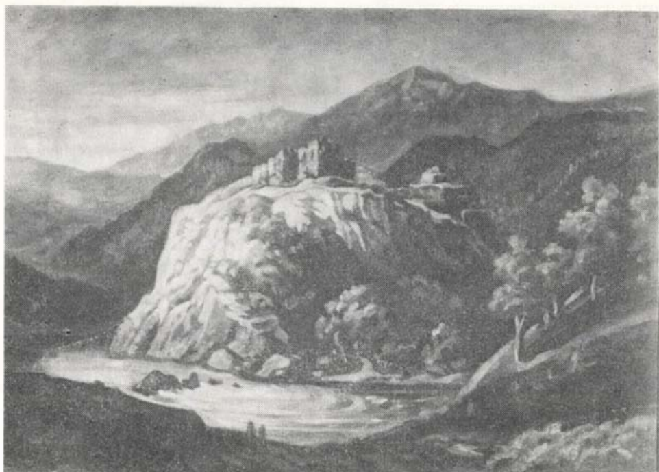
Kővár vára 1869-ben

Az első szerint II. Rákóczi Ferenc generálisa és gazdasági „gubernátora”, ifj. Teleki Mihály jobbágyának vagy familiárisának, a kis Kovás faluban lakó Csizmadia Bozga Kovási Gergely nek „dolga volt Rákóczival”. A másik hagyomány pedig az, hogy a koltói somfa csemetéjét még Rákóczi szabadságharca idején ültették el.