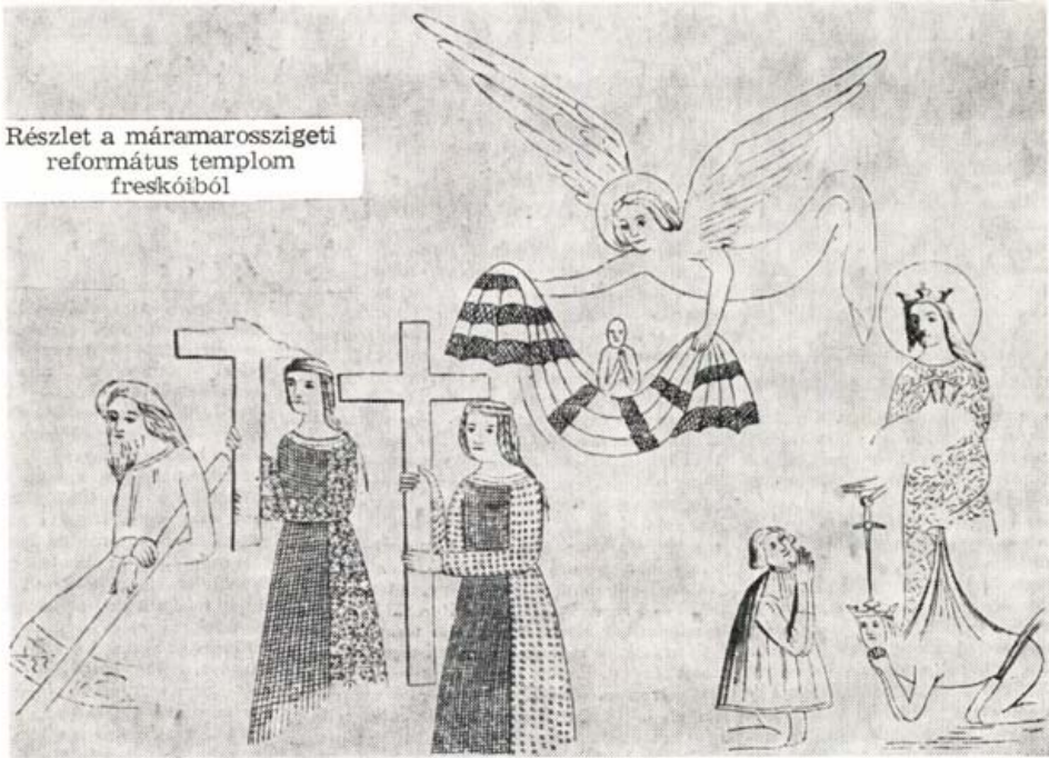
Részlet a máramarosszigeti református templom freskóiból

megjelent 18 munkáját megelőző időszakban felmerült adatokra kívánok rámutatni, kiegészítve az anyagot P. Szatmáry Károly tanulmányával. 19