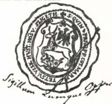
Az öt koronaváros pecsétje