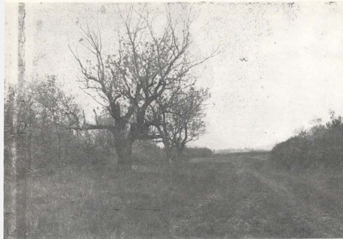
Szabadkigyósi táj.

volt a vaddisznó, 1975 szeptemberében pedig hármat is lőttek a Nagyerdő mögött. Biztosan a gyulai erdőkből a kukoricásokon keresztül elkóborolt példányok lehettek, de nyugalom esetén még a vaddisznó is jó életlehetőségeket talál itt. Szép, erős őzek, nyulak, rókák és fácánok élnek itt, a vadászok nagy örömére.