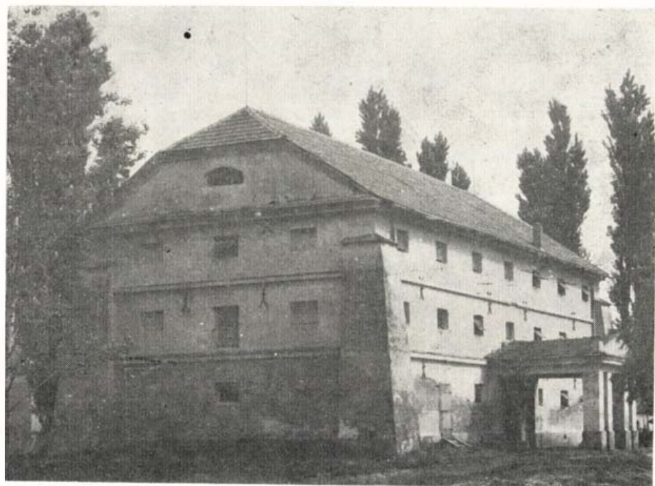
Magtár Szabadkigyóson. Tervezte Ybl Miklós.

A vidék állatvilágáról való eddigi ismereteink bizonyossá teszik, hogy legjelentősebb közülük a madárvilág. Természetesen a részletes megfigyelések szolgálhatnak még meglepetésekkel is. A pusztában hosszú évtizedekre visszamenően ismeretlen