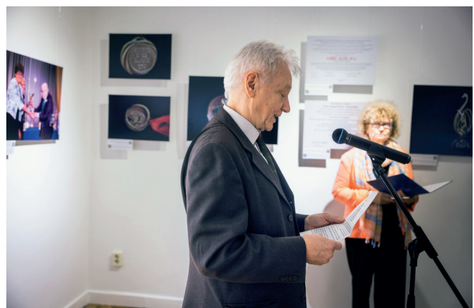
Krisztin Tibor köszöntője

A „Karikó Katalin elismerései a tanulmányi versenyektől a Lasker-díjig” című fotó- és dokumentumtárlat az SZTE Nemzetközi és Közkapcsolati Igazgatóság, valamint az SZTE Klebelsberg Könyvtár közös projektje. Az SZTE díszdoktora, az akadémikus,