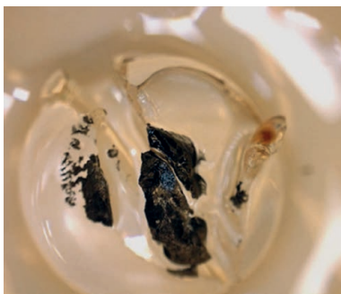
7. ábra. Oxigénfejlődés akrilgyöngyben (ezüst-nitrát-oldat elektrolízise)