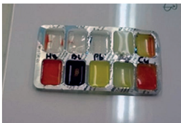
3. ábra. A tablettartató mint reakciótér

ban, akár nagy létszámú osztályok esetében is. Két nehézség szokott felmerülni: nem lehet napokkal előre előkészíteni a kísérletet, mert a kis anyagmennyiségek miatt előfordulhat, hogy az oldatok beszáradnak. A tanulóktól bizonyos fokú önmérsékletet és jártasságot követel meg, törekedniük kell a túltöltés elkerülésére – annak érdekében, hogy a szomszédos mélyedésekben lévő reagensek ne keveredjenek egymással. Tablettartókban mindazok a csapadékképződéssel járó, közömbösítési és gázfejlődéssel járó reakciók elvégezhetők, amelyek a mikroszkópi módszerek bemutatásáról szóló részben szerepelnek (3. ábra).