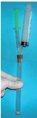
2. ábra. Acetilén előállítását kalcium-karbid és víz reakciójával

készüléket úgy tartjuk, hogy néhány ujjunkkal a gumidugót enyhén szorítsuk a kémcsőhöz! Lassan – cseppenként! – kezdjük el a \text{H}_2\text{O}_2 adagolását! Megindul az oxigénfejlődés, mivel a \text{MnO}_2 katalizálja a hidrogén-peroxid bomlását: 2 \text{H}_2\text{O}_2 \rightarrow 2 \text{H}_2\text{O} + \text{O}_2 . Minden egyes csepp beadása után enyhén húzzuk meg a gázfelfogó fecskendő dugattyúját! Folytassuk a gázfejlesztést, míg a gázfelfogó fecskendő meg nem telik! Az első adag gázt engedjük a levegőbe! A második adag már kellően tiszta ahhoz, hogy biztonságosan kísérletezzünk vele.