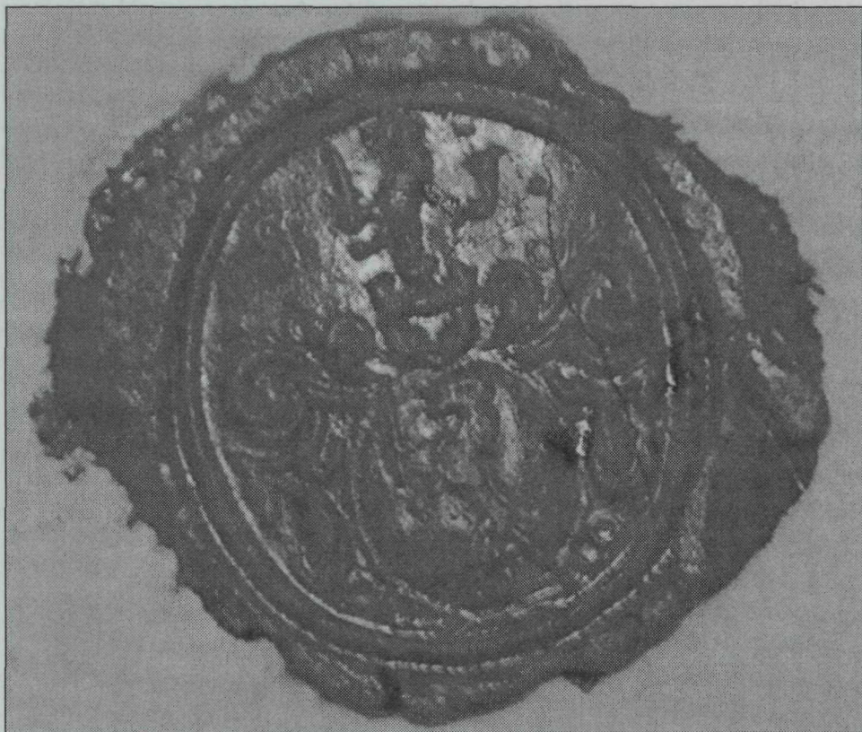
A család címeres pecsétje