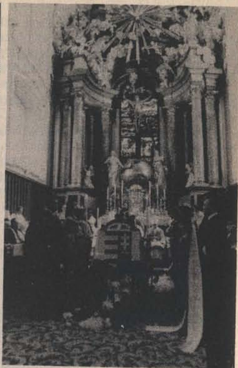
néhai Mindszenty József bíboros ravatalon Máriazell-ben (Ausztria) 1975. május 15-én

Nagyméltóságú DR. RAVASZ LÁSZLÓ a Dunamelléki Magyar Református Egyházkerület 25 éven át püspöke, a Kálvin téri ref. templom lelképásztora, a református egyháztörténelem kimagasló hirdetője, a volt magyar felsőház tagja, a Magyar Tudományos Akadémia tb. tagja, számos vallásos és irodalmi mű szerzője 1975. augusztus 6-án Budapesten hosszas betegség után 92 éves korában elhunyt.