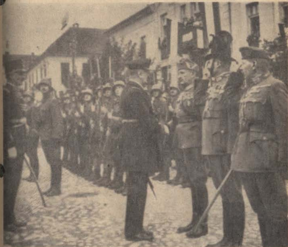
Horthy Miklós Székelyudvarhelyen 1940 őszén.