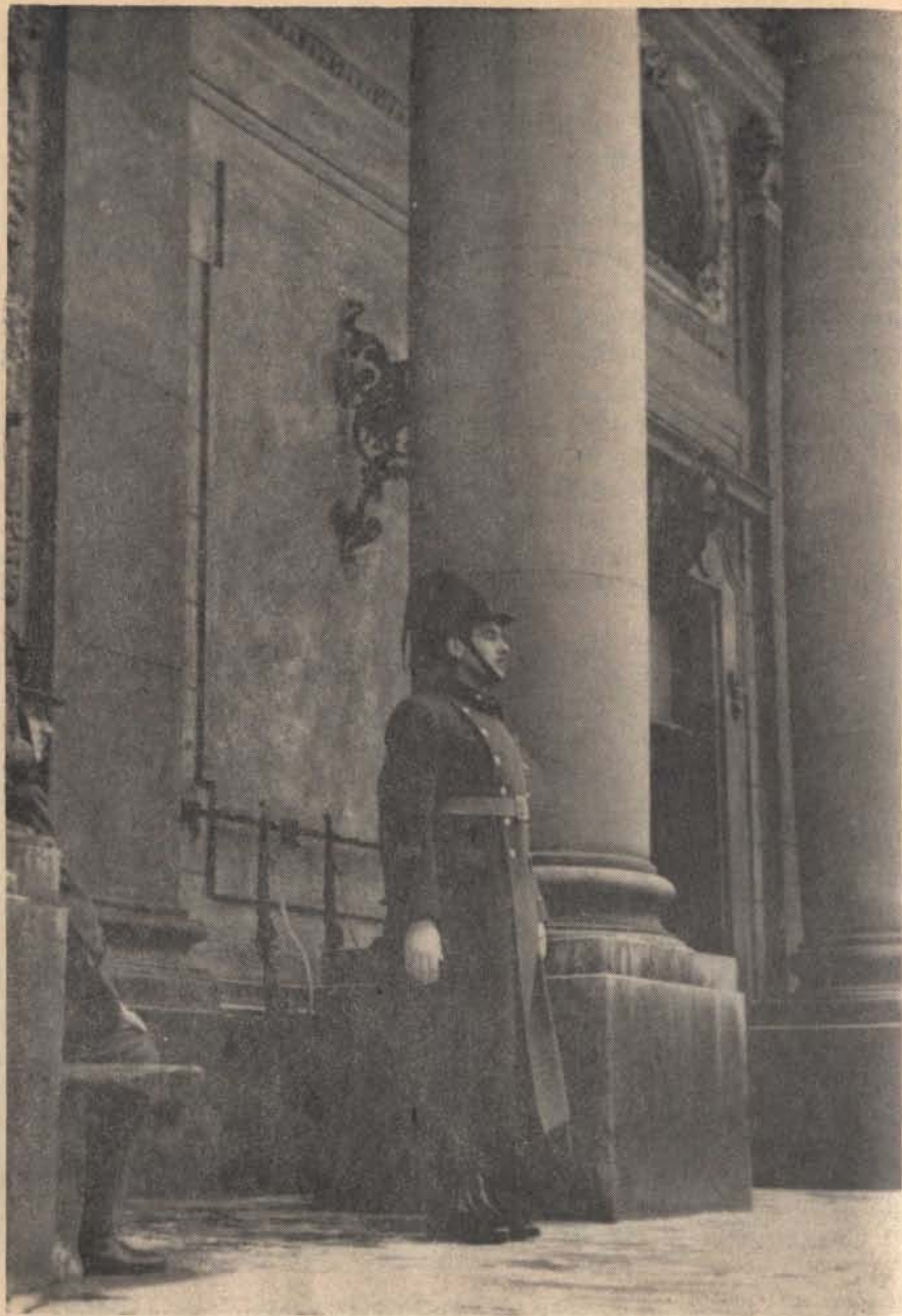
Udvarlaki őrsgébn: a magyar pompei katona, a csendőr...