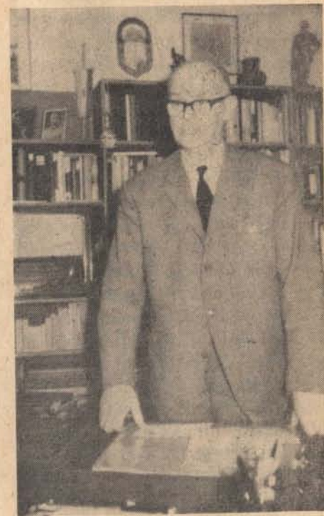
vitéz kisbarnaki Farkas Ferenc vezérezredes dolgozószobájában 1967 nyarán

A megindult kivándorlások 1948 után 3 világrészbe szórta szét csendőr bajtársainkat. Ahogy gyülekeztek új hazájukban, úgy alakultak