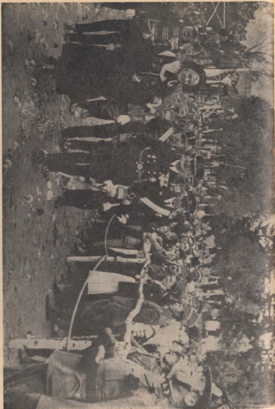
Az országgyarapító kormányzó Székelyudvarhelyen 1940 őszén.

Kérjük Bajtársainkat, hogy közöljék a központtal az összes bajtársi híreket! Sikerek, betegségek, haláleset, házasság, a csendőr gye- rekek haladása stb. mindnyájunkat egyformán érdeklő hír világviszonylatban. A Bajtársi Levél mindenkor közli ezeket a híreket. A tudósítások be nem érkezése miatt viszont sohasem lehet felelős se a lapunk, se annak szerkesztősége.