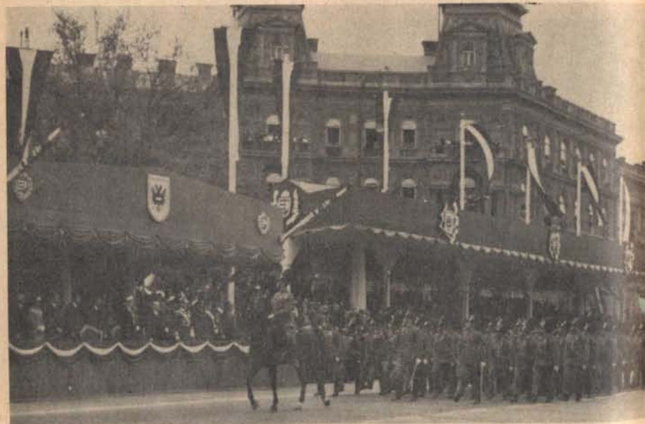
A csendőr zászlóalj díszmenete Miklas osztrák kancellár budapesti látogatásakor 1937-ben.

porába fektették. Akkor a kocsmáros áthívta a másik cetniket is segítségül, de azt ajánlotta neki, hogy a tányérsapka helyett az őrszoba szekrényéből az ottmaradt kakastollas kalapot tegye a fejére. Amikor ezzel megjelent a kocsmában, a legények nyomban lehiggadtak és szép sorban leültek megint az asztal mellé. Hogy pontosan így történt-e, nem tudom, de így mesélték ezt Nagy Lévárd környékén abban az időben és minket, magyar gyerekeket büszkeség töltött el, hogy a magyar csendőr a legkülönb nagy világon. Így olvastam aztán később egy őszinte német könyvben is, hogy a kanadai lovas csen-