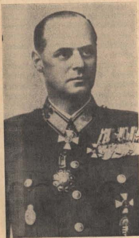
vitéz kisbarnaki Farkas Ferenc vezérezredes

Mint a villám, száguldott végig a hír nyugaton: vitéz Farkas Ferenc vezds megalakította a Magyar Szabadság Mozgalmat! A hírt bő-