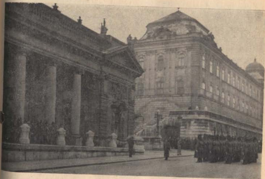
Csendőr őrsváltás a királyi palotában 1943. február 14-én. A háttérben József Apánk, vitéz Habsburg József királyi herceg, tábornagy palotája.

biztonságának, csendjének öre és ezt a feladatát mindig férfiasan, bátran teljesítette. És hozzátehetjük azt is, hogy a nyugatos emigráció csoportjai közül éppen a csendőrség volt az, amelyet a rángerősített új világ leginkább igyekezett ferde színben bemutatni, sárba rántani. (Milyen fontos lenne, ha valaki a csendőr írók közül könyvben vagy cikksorozatban be-