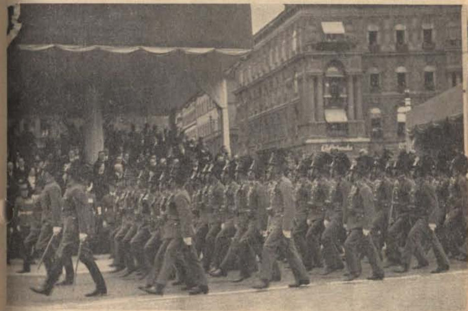
A csendőr zászlóalj díszmenete Miklas osztrák kancellár budapesti látogatásakor 1937-ben.

gerben és a tábor gyermekeit szeretete és vigyázta. A felsőausztriai Attnang fontos vasuti gócpont volt és a háború utolsó hetében még porig bombázták, hogy aztán az „ami” csapatok bevonulása után megint gyorsan újraépítsék. A munka sürgős volt, nehéz volt. Így az ottrekedt magyar katonaság és csendőrség vállalta az újjáépítést. (Ha valaki az itteni tehetősek közül látogató utazást tesz mostanában Ausztriában és Attnangon is átutazik, emelje meg a kalapját az állomáson, mert annak minden kockájához magyar katona és csendőr verejtékcsoppja tapadt.) Pista Bácsi is ott dolgozott Attnangban,