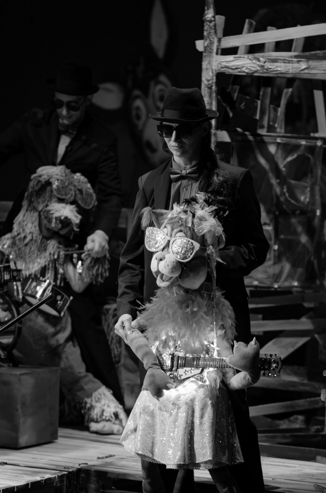
Brémai muzsikuskok, Regina Maria Színház, Arcadia Társulat, Nagyvárad.

A kisebbek azonban vágnak a mesékre, a társulatok egyértelmű és elengedhetetlen célja a szerethető és tanulságos mesevilág megteremtése. Az erdélyi bábjátékra jellemző, hogy életben tartja a népmeséket is egy-egy adaptáció színrevitelével. Az Udvarhelyi Bábműhely és a Marosvásárhelyi Művészeti Egyetem mesterszakon végzett bábszínész hallgatói az Aranyszívű Juliskát hozták el a fesztiválra. A szép, népies látványvilágú és gyakran zenével, dalban mesélő előadásban Juliska azt tapasztalja, hogy bármilyen jó mostohaanyjához és mostohatestvéreihez, bármilyen készségesen és jó szándékkal látja el feladatait a királynál, csak kigúnyolják és kihasználják. A növények, az állatok viszont, és később még az emberek is hálával fordulnak felé, így arany szívűségéért idővel mégis hála jár. Fontos gondolatot hordoz ez a bábos mese, amelyben egyszerre vannak jelen csodálatos szereplők – mint a beszélő káposztakirály vagy az aranyszörű kecske – és az olykor komor, de igazságos valóság. A sepsiszentgyörgyi Cimborák Bábszínház egy, Bartók által gyűjtött gyerekdalból kiindulva hozott létre teljes élőzenés előadást, ez lett az 1x1 királyfi , amelyben a jól ismert dalamon kívül főként népdalok, de operettrészlet, zongorajáték, hegedű, gardon is hallható.