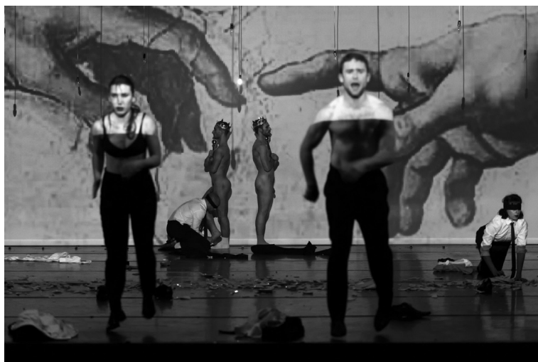
Jelenet Jan Fabre The Power of Theatrical Madness (2012) c. előadásából.

Az avignoni fesztiválon láttam Anne Teresa de Keersmaeker Partita 2 című előadását, amelyik úgy kezdődött, hogy a pápai palota hatalmas terébe bejött egy zenész, és teljes sötétségben hegedült 15 percet. Lehet, nem volt éppen ennyi, de én nagyon hosszú időnek éreztem. Nem értettem, hogy történhet meg ez egy táncelőadásban – hiszen nem koncertre mentünk, ugyebár. Majd ugyancsak Avignonban láttam egy Jan Fabre-előadást ( The Power of Theatrical Madness ), amelyben a színészek konkrétan fizikailag bántalmazták egymást az egyik jelenetben. Emlékszem, nagyon nehéz volt a székben maradni. Alig tudtam visszafogni magam, hogy ne menjek oda hozzájuk, és mondjam, hogy ezt nem tehetik. Persze tudtam, hogy előadásom vagyok, de a rúgások igaziak voltak. Teljesen zavarban voltam. Vagy ugyanebben az előadásban az előadók