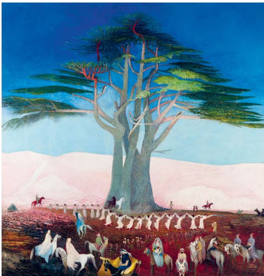
Csontváry Kosztka Tivadar: Zarándoklás a cédrusokhoz Libanonban , 1907, olaj, vászon, 200 × 192 cm, Magyar Nemzeti Galéria, Budapest, fotó: © Szépművészeti Múzeum 2022