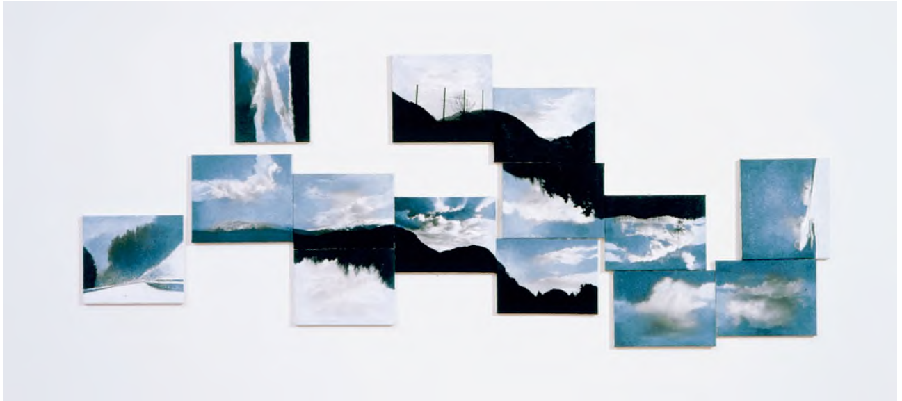
Köves Éva: Budapest – Velece (Felhők) , 1997, festményinstalláció, 14 db festmény; olaj, plextol, zselatinos ezüst fotópapíron, vászon; installáció mérete 100 × 200 cm, fotó: © Rosta József, © Ludwig Múzeum – Kortárs Művészeti Múzeum / HUNGART © 2022