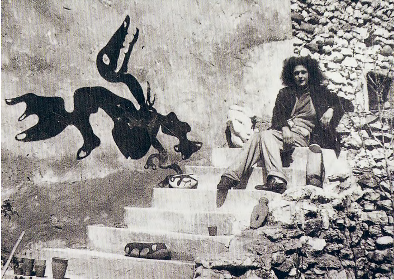
Leonora Carrington és Max Ernst Saint-Martin-d'Ardèche-i otthonukban, archív fotók