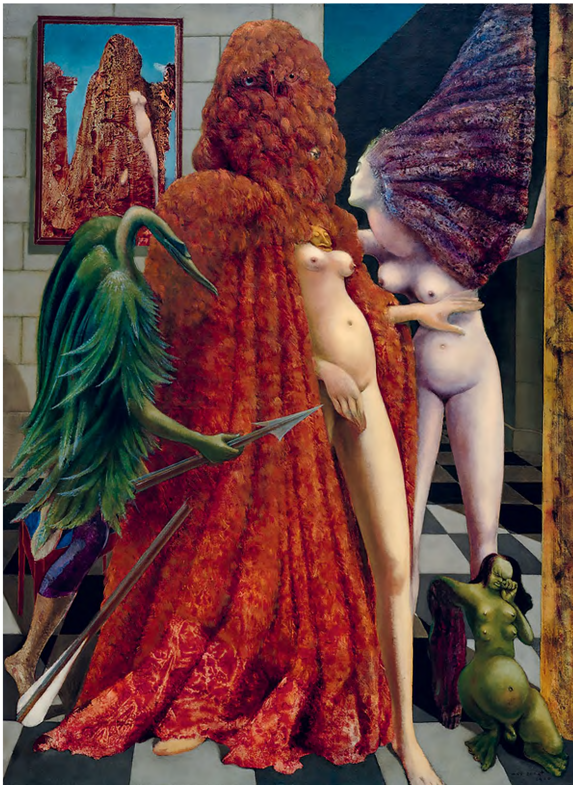
Max Ernst: Attirement of the Bride (Az öltözködő menyasszony), 1940, olaj, vászon, 129,6 × 96,3 cm, fotó: Peggy Guggenheim Collection, Venice (Solomon R. Guggenheim Foundation, New York) / HUNGART © 2022