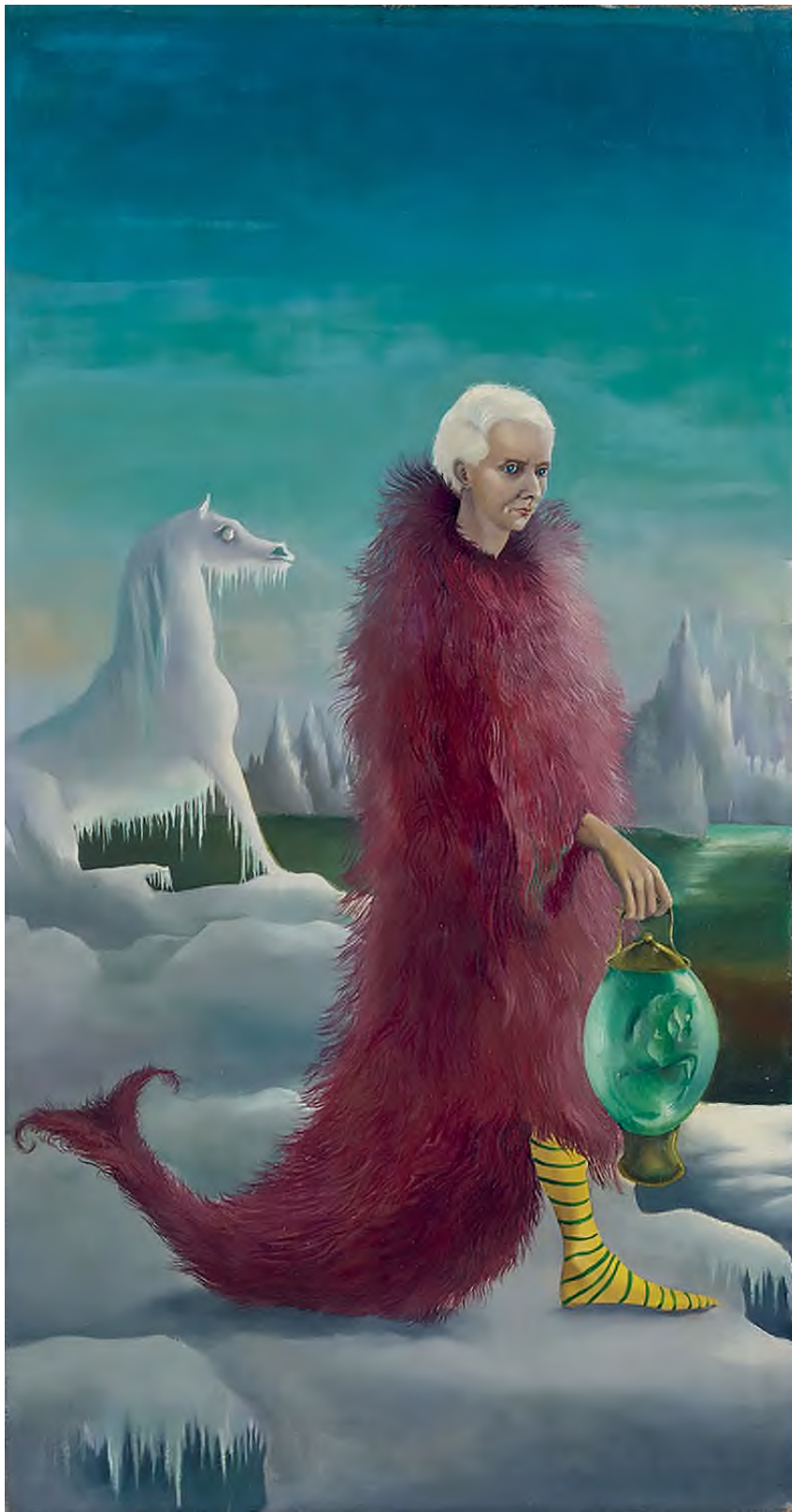
Leonora Carrington: Portrait of Max Ernst (Max Ernst portréja) , 1939 körül, olaj, vászon, 50,3 × 26,8 cm, National Galleries of Scotland, Edinburgh, © Leonora Carrington / HUNGART © 2022

ölti magára. A lilában játszó fehér Királynő a Király vörös palástjába bújik. A palást erőt demonstrál, mintha harci dísz lenne, az arcot állati maszk takarja el, a női keblek alatt megjelenő genitáliát tollak alól kinyúló kéz rejt. Az éppen csak kilátszó szeméremvonal talán a mezítelen menyasszony vénuszdombját ismétli, az előrebillenő csípő és az agresszíven oda-bökö lándzsa azonban maskulinitást sejtet. Könnyebb dolgunk van, ha a kép mellett látjuk Carrington 1939-es portréját Ernstről, ahogy a kiállításon is: a művész ugyanebben a vörös tollbundában, hasonló pózban jelenik meg rajta. De kódolható úgy is a palástot viselő menyasszony, ha ismerjük Lopopot, Ernst madár alakot öltött felettes perszónáját, akit önmaga szimbólumaként használt. 1938-ban jelent meg Carrington első szövege, A félelem háza , 7 Ernst illusztrációival. Az angol abszurd történetmesélést és a szürrealista fekete humort ötvöző mű előszavát Ernst írta; alcíme szerint Loplop bemutatja a szél menyasszonyát. A képretegekben így ott van a szélmenyasszony Carrington is.