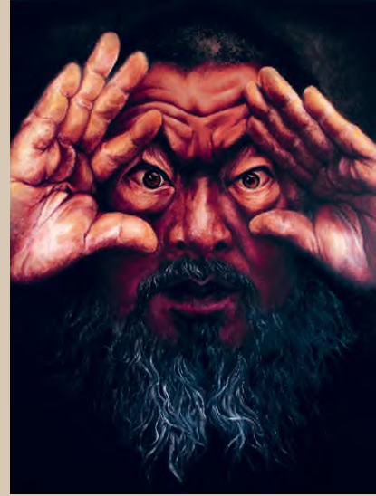
Badiucao: Ai , 2015, olaj, vászon, 106 × 77 cm, © Badiucao

La Cina non è vicina. Badiucao – opere di un artista dissidente (Kína nincs közel van. Badiucao – egy emigráns művész munkái), Museo di Santa Giulia, Brescia, 2022. február 13-ig