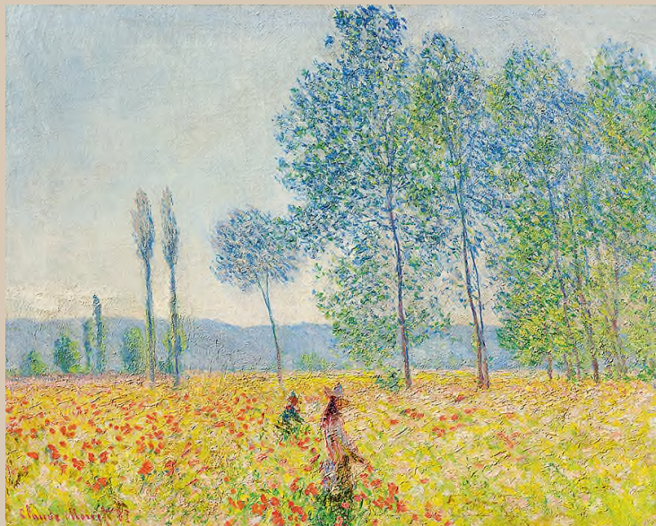
Claude Monet: Nyárfák alatt , 1887, olaj, vászon, 73 × 92 cm, Hasso Plattner Collection, Museum Barberini, Potsdam

A Barberini névről mindenkinek Róma jut az eszébe, okkal, de 2017 óta van egy Barberini Museum Potsdamban is. Semmi köze nincs a római családhoz, leszámítva azt, hogy valaha a barokk palotát a palazzo Barberini mintájára tervezték és építették. Az épületet szinte az utolsó pillanatban, mármint a 2. világháború utolsó pillanatában, 1945 áprilisában bombázták szét, az NDK-időkből a romos ház parkolóként funkcionált, aztán jött a gondolat: föl kell építeni. Amennyire csak lehet, az eredeti állapotban. A pénzt, majd utóbb a képeket is a Hasso Plattner Alapítvány adta, így legalább az egészen elképesztő gyűjteménynek is van biztos helye. Plattner elsősorban impresszionistákat gyűjtött, harmincnégy Monet boldog tulajdonosa, övé a legnagyobb Monet-gyűjtemény Párizson kívül. Ezek közül egy a Nemzeti Galéria Szinyei-kiállításán most élőben is megtekinthető.