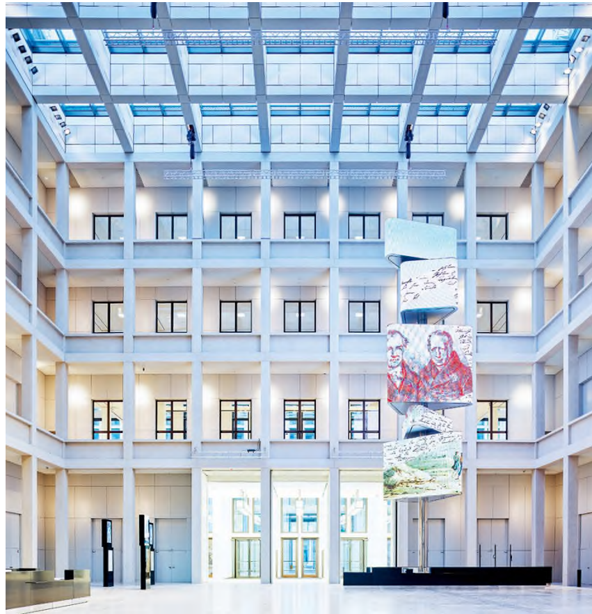
A Humboldt Forum előtere a nagy méretű információs toronyként és világító reklámként működő Kosmograffal, © Stiftung Humboldt Forum im Berliner Schloss, fotó: © Alexander Schippel / HUNGART © 2021

Mindez jól hangzik, és érvényes út lehet, de nem minden múzeum számára. Amikor Marion Ackerman, a drezdai Staatliche Kunstsammlungen igazgatója szavait olvasom arról, hogy „ sok múzeum számára komoly terhet jelent, hogy nemzeti intézmény ”, nem tudok nem gondolni a Magyar Nemzeti Múzeum