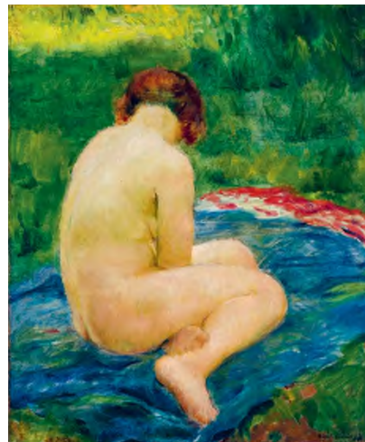
Bánáti Sverák József: Füvés után , 1925, olaj, vászon, 68 × 57 cm, Szépművészeti Múzeum – Magyar Nemzeti Galéria / HUNGART © 2021

Az általános tendenciákat tükröző művek mellett persze bőséggel akadnak e műfajnak olyan miskolci eredményei is, melyek messziről elkerülik a tematikai köntösbe bújtatás gyanúját. Ezek egyik legszebbike épp a centenáriumi kiállítás „arcának” választott festmény, amely egykor a K&H Bank gyűjteményébe tartozott, majd két ízben is a Kieselbach Galéria aukcióin cserélt gazdát. Benkhard Ágost Szabadban című alkotása egyszerre aktkép és portré, hiszen az aktfestés szituációját ábrázolja. A napfénybe állított ruhátlan nőalak ebben a helyzetben pon-