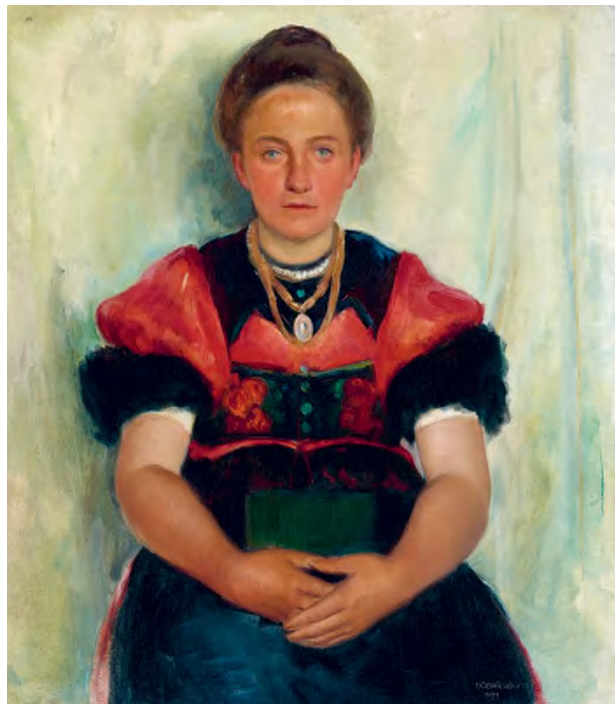
Döbröczöni Kálmán: Matyó lány , 1931, olaj, vászon, 80 × 70 cm, Herman Ottó Múzeum, Képzőművészeti Gyűjtemény

Látókörbe kerülhetnek még egyszer egyebek mellett Rozgonyi László, Bánáti Sverák József, Dudás Jenő az 1920-as évekbeli miskolci növendékiállítások alkalmával megemlégett, valamint Szuly Angéla 1931-ben a Nemzeti Szalonban bemutatott, címük szerint is ide köthető olajfestményei.