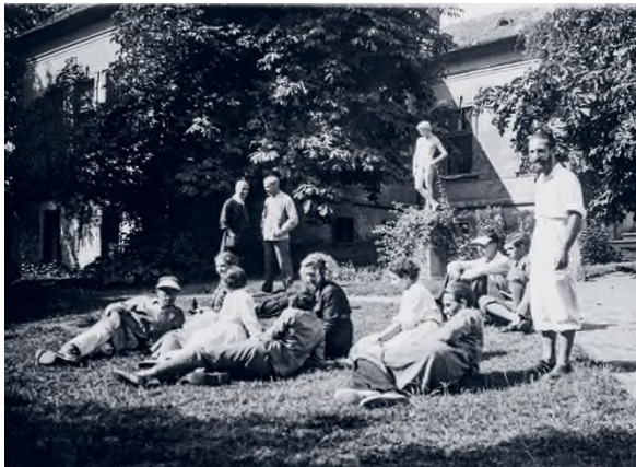
Fűben heverésző, beszélgető növendékek a művésztelep kertjében