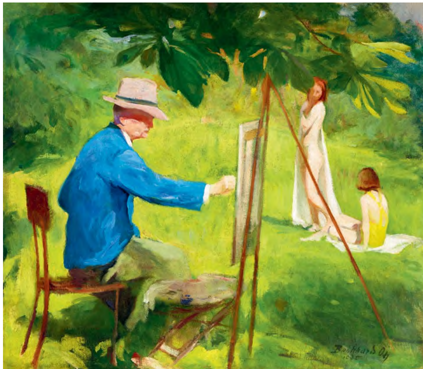
Benkhard Ágost: Szabadban (Réti István fest), 70 × 80 cm, olaj, vászon, magántulajdon, a Kieselbach Galéria közvetítésével, fotó: Kieselbach Galéria archívuma / HUNGART © 2021