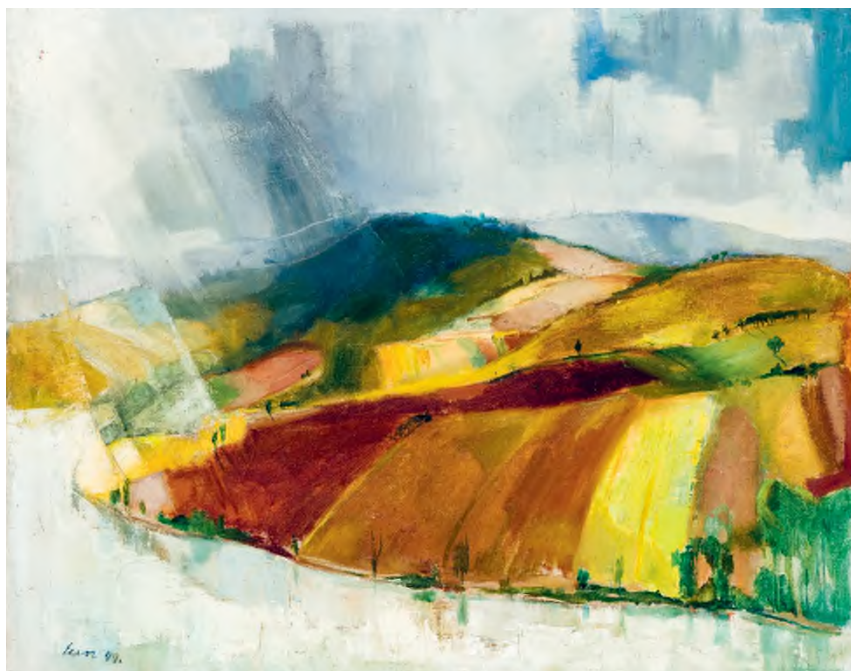
Szin György: Dudujka , 1933 körül, olaj, vászon, 63 × 78,8 cm, Szépművészeti Múzeum – Magyar Nemzeti Galéria

Szin György tájképe kezdettől a Dudujka címet viseli. A művész az 1930-as évek elején tartózkodott a telepen. Itt született munkáját – a hátoldalon megmaradt cédulák segítségével visszakövethetően – a Szinyei Társaság egyik Nemzeti Szalon-béli tárlatáról vehette meg a Vallás- és Közoktatásügyi Minisztérium, majd a mű később a Fővárosi Képtárba került, melynek anyagával együtt 1957-ben a Magyar Nemzeti Galéria gyűjteményében találta meg véglegesnek mutakozó helyét. A képcímet a minisztérium kezelésében gondosan felvezették a nyilvántartási cédulára, így a megnevezés a későbbiekben – távol Miskolctól – már csak jelentését tekintve okozhattott – gyaníthatóan nem kis – fejtörést. A Dudujka-témájú művek a centenáriumi tárlaton önálló egységet alkotnak, képviselőiben annak a feltétlenül tekintélyes mennyiségű festménynek és rajznak, melyek e völgy szépségének igazában jöttek létre, s amelyek közül mára is sok minden megmaradhatott.