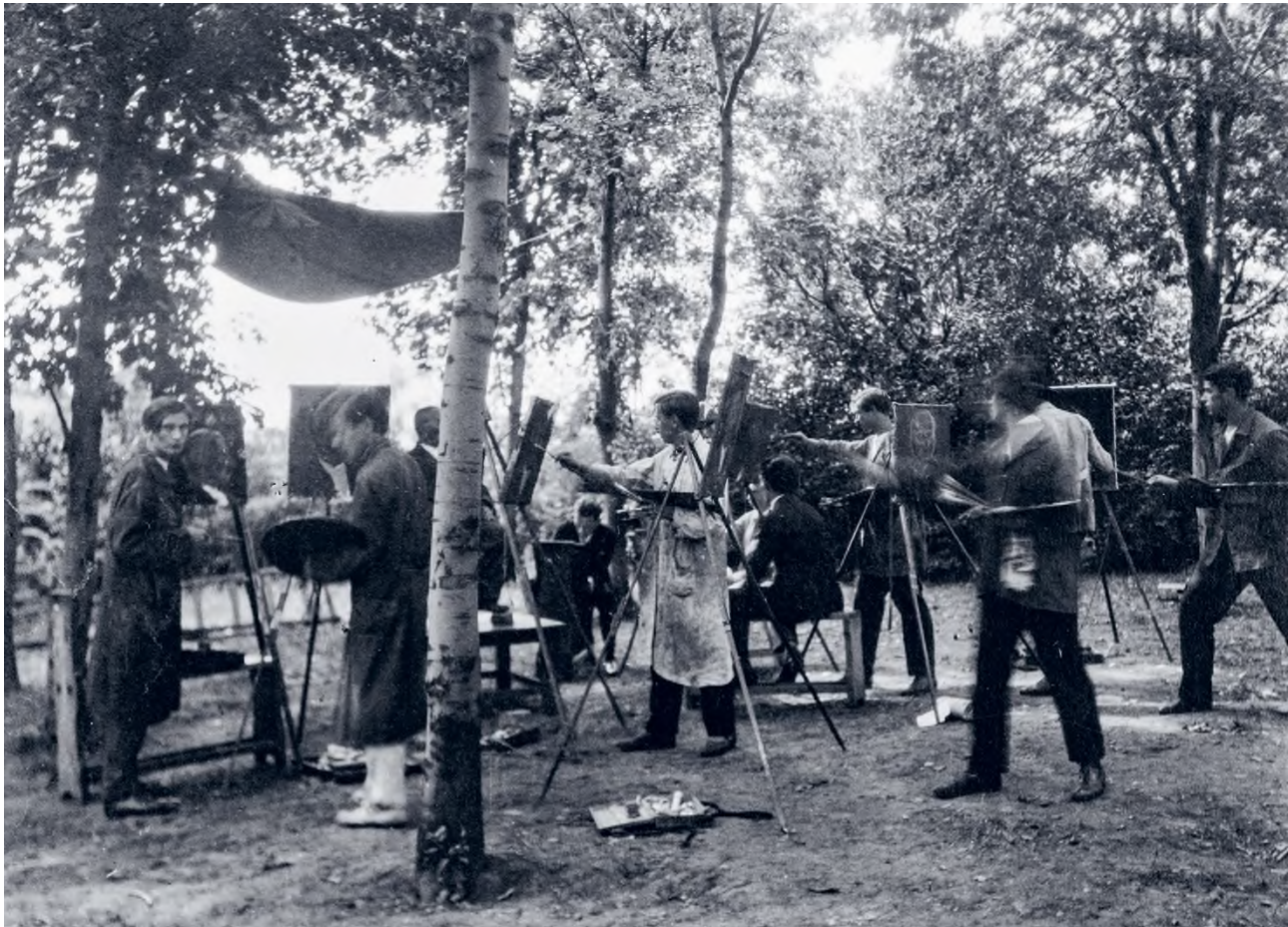
Festőnövendékek dolgoznak lázasan a művésztelep kertjében, archív fotó

A pillanatfelvétel 1925-ben készült, de az évszámnak nincs különösebb jelentősége. A nyári délelőttökön idelátogató vendégeket ugyanis minden alkalommal ez a látvány fogadta, csak épp a modell volt más és más: idős