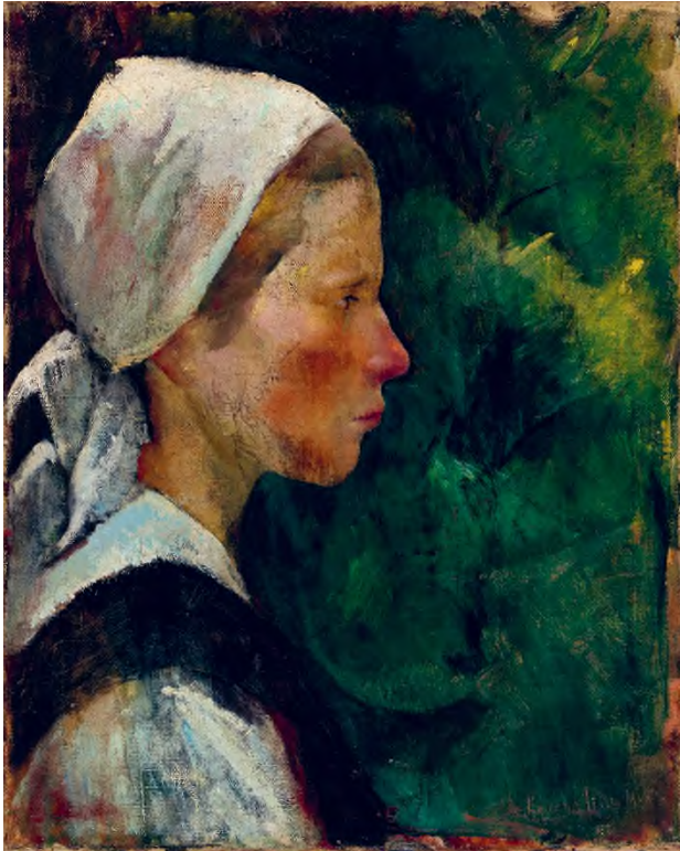
Léderer Jolán: Fejtanulmány , 1928, olaj, vászon, 50 × 40 cm, Herman Ottó Múzeum, Képzőművészeti Gyűjtemény