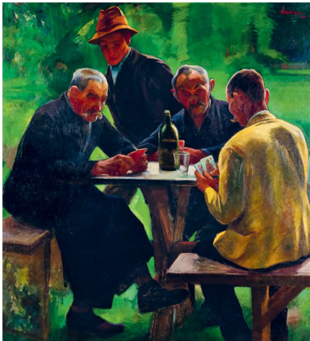
Meilinger Dezső: Kártyázók , 1935, tempera, vászon, 155 × 140 cm, Herman Ottó Múzeum, Képzőművészeti Gyűjtemény, fotó: © Mészáros Viktória / HUNGART © 2021