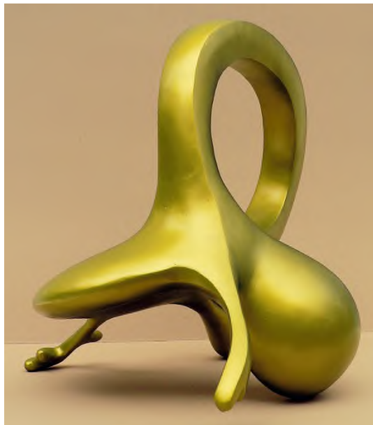
Farkas Zsófia: Gyűrűs Béka , 2008, alumínium, akrilfesték, 47 × 41 × 52 cm, 3 pld., magántulajdon, illetve a Ferenczy Múzeumi Centrum tulajdona