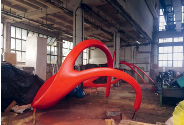
A Nagy Halak emlékezete 1–3. készülése közben az újpesti Hajójavító Főműhely szerelőcsarnokában, 2017