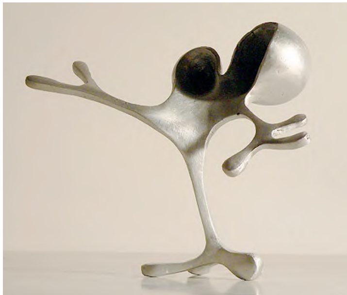
Farkas Zsófia: Szellemi Törpe , 2010, alumínium, 35 × 28 × 17 cm, magántulajdon