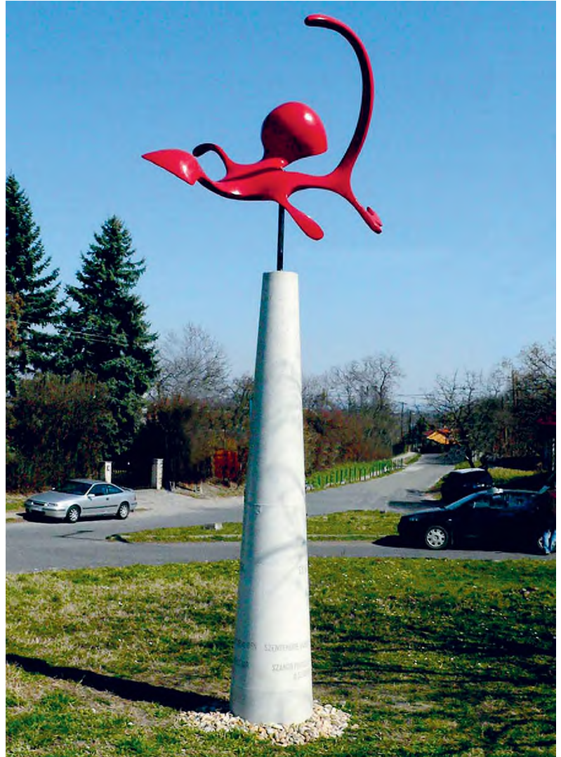
Farkas Zsófia: Szántó Piroska-émlékszobor , 2014, alumínium, akrilfesték, beton, 310 x 120 x 80 cm, Szentendre, 11-es főút és Hold utca találkozása

Valóban sokat gondolkodtam rajta, van-e átmetszés közöttük, de szerintem a zene és a szobrászat – legalábbis az a szobrászat, amit én csinálók – egészen más agyterületeket mozgat, használ. A direkt megfeleltetés erőltetett lenne. Nem tudom a zenémet átültetni a szobrászatba, tudatosan semmiképpen. De örülök annak, amit mondtál, mástól is hallottam már, hogy úgy érzik, zeneiség van a szobraimban. Egyébként mostanában – harminc év elteltével – visszatértem a zenéhez. Fiam jazzbőgőzik, lányom dobol, mindketten nagyon tehetségesek, és óriási zenei élet van nálunk, körülöttünk, ami engem is magával sodor. Újra tanulok zongorázni, ezúttal jazz-zongorázni, ami rettentően izgalmas új terület. De nem kötöm össze a szobrászattal, leszámítva, hogy mindig zenét hallgatok munka közben. Ebben mindenevő vagyok. Sokáig