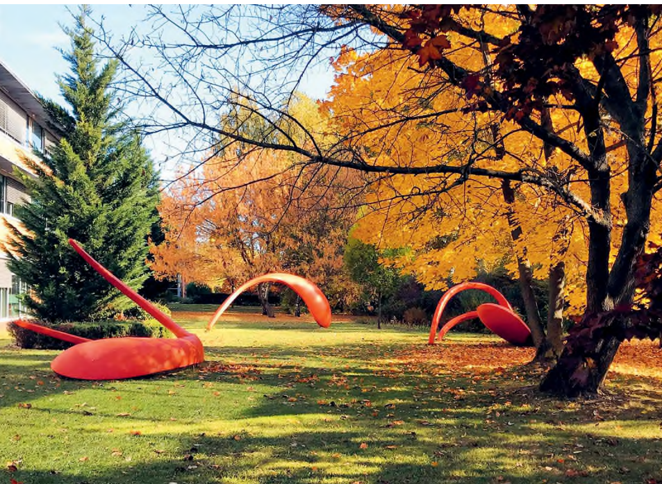
Farkas Zsófia: Nagy Halak emlékezete 1-3. , 2017, acél, poliuretán, poliurea, akrilfesték, a szobrok magassága: 180 cm, 240 cm, 280 cm, helyszín: Graphisoft Park, Budapest

Mindig is csodáltam a japán kertművé- szetet és a sintó szentélyeket. Létezik egy lakkvörös, ilyen színűre festik a szenté- lykaput, a torii -t. Ez választja el a hét- köznapi világot az istenek lakhelyétől. A fák vagy a víz zöld háttéréből fantasz-