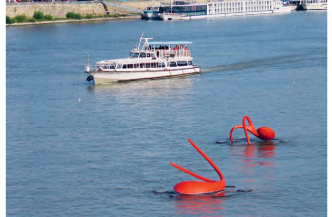
A Nagy Halak emlékezete című úszó szoborcsoport a Dunán a Szent Gellért térnél 2017 júliusában