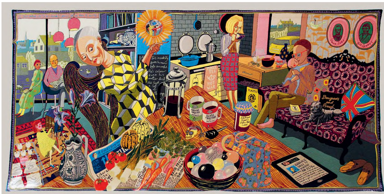
Grayson Perry: The Annunciation of the Virgin Deal (Angyali üdvözet, avagy a szeplőtelen üzlet), 2012, gyapjú, pamut, akril, poliészter és selyemkárpit, 200 x 400 cm, Arts Council Collection, London