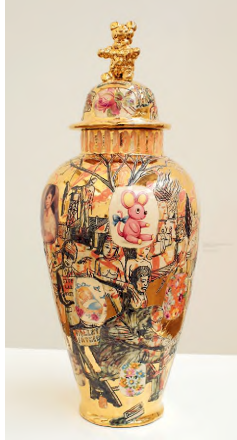
Grayson Perry: Revenge of the Alison Girls ( Az Alison lányok bosszúja ), 2000

semmi másra. Megtudjuk, hogy bár sosem volt autója, amikor az újságban meglátott egy új Jaguar-modellt, azonnal birtokolni akart egyet – mégpedig pirosat. És mivel megengedhetné magának, azonnal el is képzelte, hogy az autóban ülve rokonai felé veszi az irányt, hogy felvágjon vele. Amikor ezt elmesélte a feleségének, ő kinevette, mondván, úgy tűnik, legbelső énje a sok terápia és önreflexió ellenére még mindig irreális és szükségtelen elvárásoknak, vagyis egy maskulin ideálképnak igyekszik megfelelni.