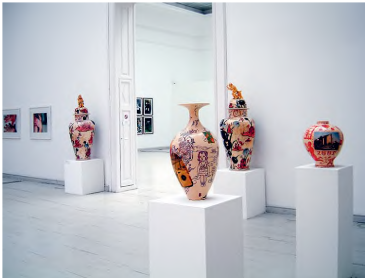
Részlet a Múcsarnok 2003-ban rendezett Micro/Macro: Brit művészet 1996–2002 című kiállításából Grayson Perry munkáival