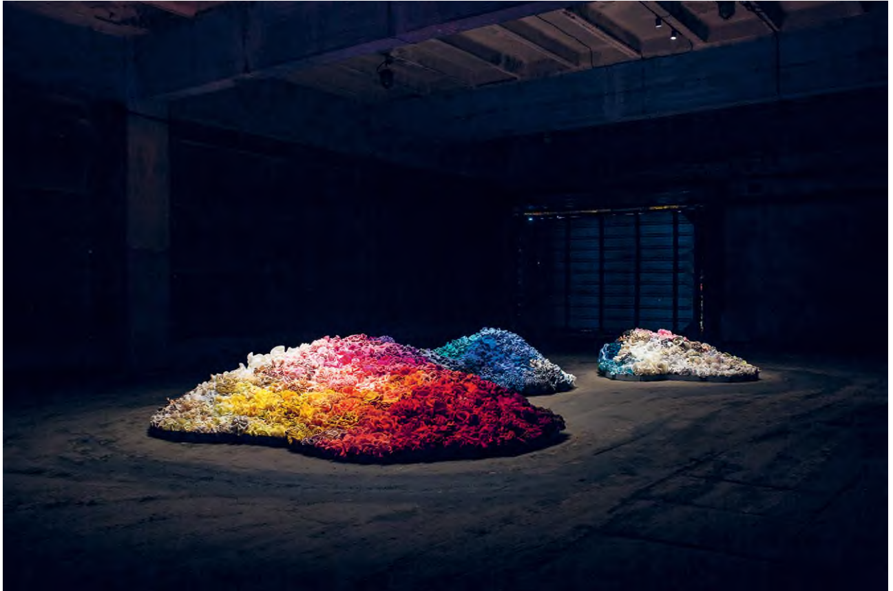
Daina Taimiņa: Dreams and Memories (Álmok és emlékek) , 2020

© Daina Taimiņa / HUNGART © 2020