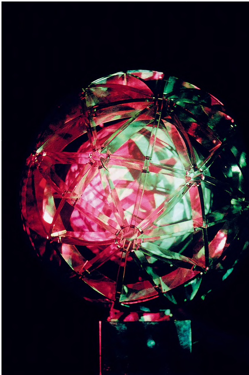
Valdis Celms: Pozitron , 1976–1977 © Valdis Celms / HUNGART © 2020

kórossá, hogy utánozzák mára bezárt munkahelyük régi jellemző hangjait. A homoszexualitás társadalmi kontextusának változásai több műben is megjelennek, legerősebben a helyi vonatkozásokkal. Jaanus Samma Rigai képeslap