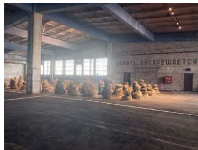
Képek a biennálé helyszínéről