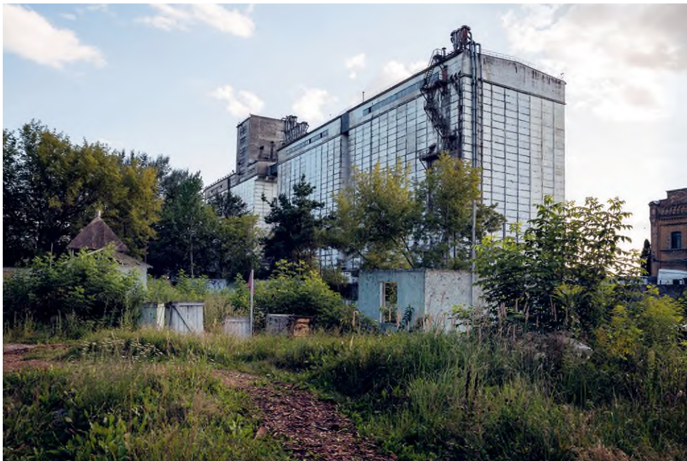
Képek a biennálé helyszínének 19. és 20. századi elhagyott épületeiről Riga egykori ipari kikötője, az Andrejsala nevet viselő városrész területéről