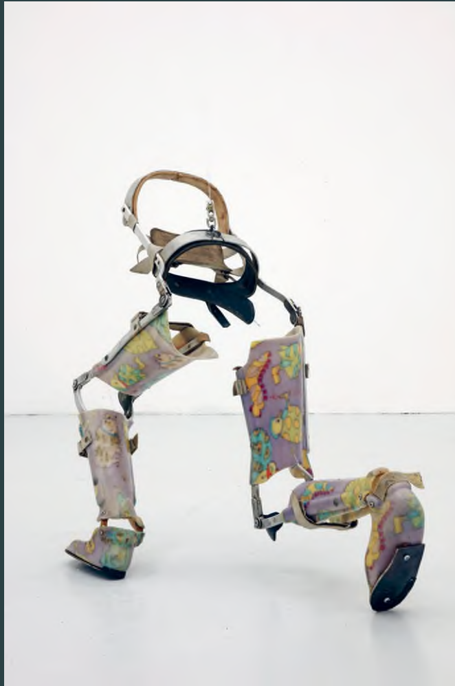
Berenice Olmedo: Olga , 2018, kemény műanyag lábortézis, acélrudak és -csuklók, csavarok, alumíniumdoboz, elektromos motor, CPU-vezérelt hardver, 38 x 76 x 32 cm

© Berenice Olmedo / Foto: © Johannes Post / HUNGART © 2020