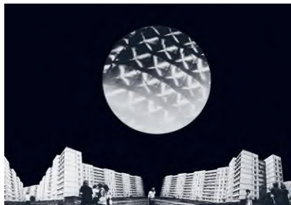
Valdis Celms: Architectural proposal Kinetic Light Object 'Balloon' (Építészeti javaslat a Balloon című kinetikus fény objektre), 1978, fotómontázs, karton, 56,5 x 91,5 cm, Collection of the Latvian Artists' Union © Valdis Celms / HUNGART © 2020