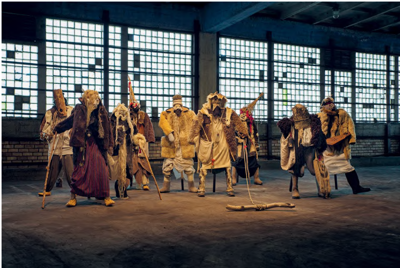
Nikolay Smirnov: Religious Libertarians (Vallásos libertárusok) , 2020

© Nikolay Smirnov / HUNGART © 2020