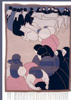
Vaszary János: Jegyespár , 1905, szőnyeg, 152 x 116 cm, Iparművészeti Múzeum, Budapest