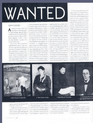
Barki Gergely: Wanted . In: Artmagazin , 2005/1.