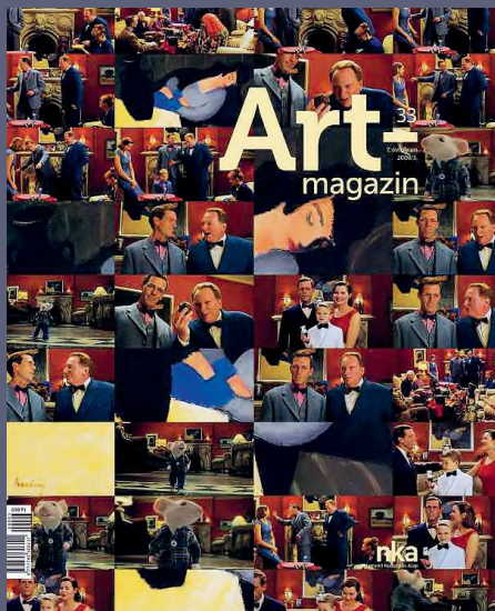
Az Artmagazin 2009/3. száma, a címlapon a Stuart Little, kiséger című film