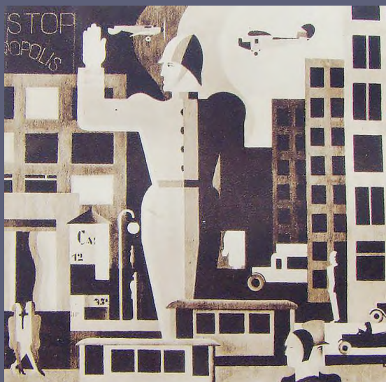
Bortnyik Sándor: Világrendőr , 1927