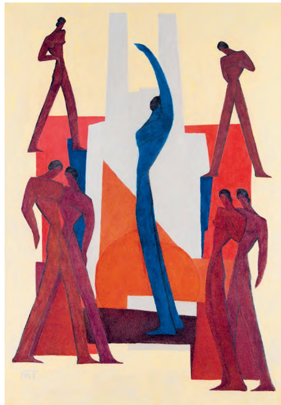
Balról jobbra: Mattis Teutsch János kései, letörölt munkája; Mattis Teutsch János: Az új ember , kazeintempera, vászon, 148 x 99,5 cm