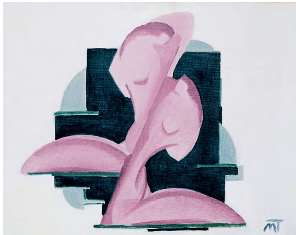
Mattis Teutsch János: Kompozíció, 1925 körül, olaj, karton, 40 x 50 cm HUNGART © 2020