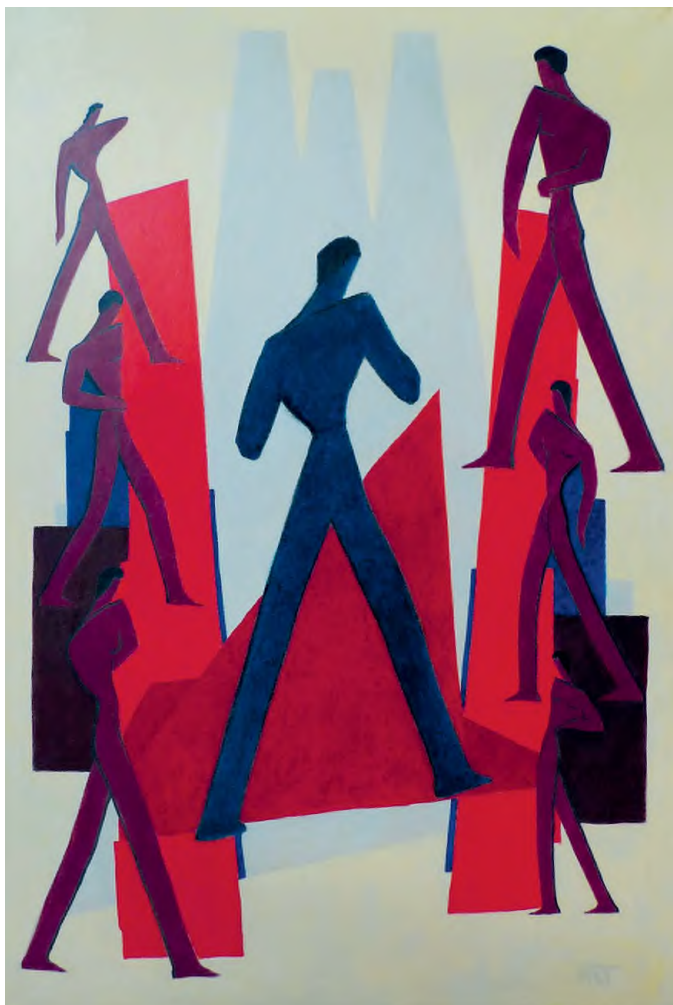
Mattis Teutsch János: Gyárban , kazeintempera, vászon, 148 x 100 cm HUNGART © 2020

meglehetősen egyedülálló és kiemelkedő szerepe a 20. század első felének magyar művészetében, holott életművének ez a majd' három évtizede az egyik leg hosszabb és legkonzekvensebb, nagyobb törések nélküli alkotói periódusa.