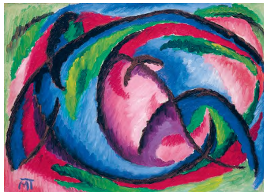
Mattis Teutsch János: Kompozíció , 1920 körül, olaj, karton, 29 x 39 cm HUNGART © 2020