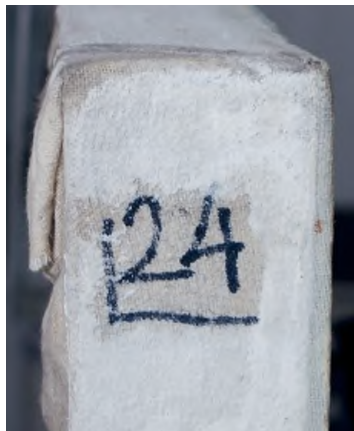
Az átfestett kép Mattis Teutsch János által meghagyott sorszáma és egy másik megőrzött szám