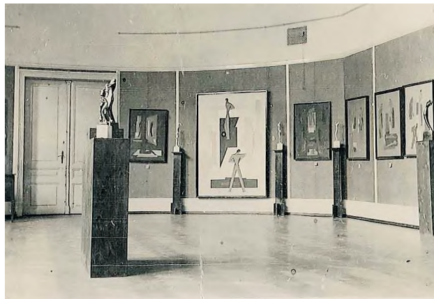
A brassói Redut kiállítóterem 1930-ban vagy 1933-ban Mattis Teutsch János kiállításával, archiv fotók

Visszatérve Boros Judit írására, feltűnő és egyben érthetetlen, hogy végig megkerüli azt az egyáltalán nem mellékes tényt, hogy a képek felső rétegeinek eltávolítása után nem üres vásznak maradtak hátra – nem képrombolás történt tehát –, hanem Mattis Teutsch avantgárd festői kiteljesedését (és egyben e korszak lezárását is) jelentő művek jónéhány darabja. Amelyek ráadásul az utókor számára addig láthatatlanok voltak, csak fekete-fehér, archiv kiállítási enteriőr-fotókról voltak ismertek. Nyugodtan kijelenthető, hogy ezek a most láthatóvá („létezővé”) tett alkotások az életmű kiemelkedő darabjai, mind stílusuk egyediségét, művészi kvalitásukat, mind Mattis Teutsch életművében addig soha nem ismert nagy méreteiket tekintve. E méretek szorosan összefüggnek azzal a törekvésével, hogy végre igazán nagy, monumentális műveket hozzon létre. Írásaiban többször megemlíti, mennyire vágyik nagy méretű, murális munkák megrendelésére közösségi épületekben, ilyen terek falain. E korszak művei mindezidáig (a néhány kép letisztításáig) teljességgel hiányoztak az életműből, a 2001-ben a Magyar Nemzeti Galériában és a müncheni Haus der Kunstban a MissionArt