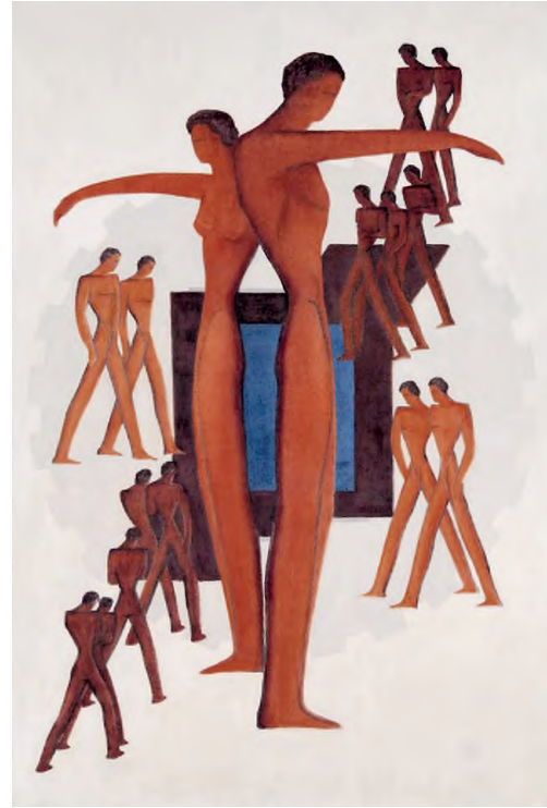
Mattis Teutsch János kései, letörölt munkája és Mattis Teutsch János: Együtt , kazeintempera, vászon, 148 x 100 cm HUNGART © 2020

a művek középső mezőire koncentrá- lódik, és a homogén háttér elé egy-egy zárt, gyakran elvont elemeket is tartal- mazó konstrukció kerül. Ezzel egy idő- ben a figurák is egyre felismerhetőbbé válnak, gyakran megkülönböztethető női, férfi jegyeket hordozva. E csak fi-