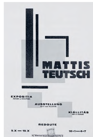
Mattis Teutsch János egyik brassói kiállításának plakátja

Ha pedig etikailag közelítünk a kiinduló problémához, amely a képek felső rétegének eltüntetéséből fakadt, akkor azt is vegyük figyelembe, hogy Mattis Teutsch halála előtt néhány nappal el kívánta égetni összes festményét, amely tevékenységhez akkori növendékét, Boros Lajos festőművészt hívta segítségül.