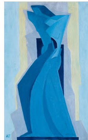
Mattis Teutsch János: Tovább, 1926, olaj, vászon, 98,3 x 61,8 cm HUNGART © 2020

Ha megnézzük, nagyon beszédesek az ekkor készült képek címei, főleg, ha ezeket összevetjük a csak néhány évvel korábbi kiállítás képcímeivel. Lássuk, melyek ezek 1933-ban: Munkára fel, Emberek, Erő, Mérnökök, Futószalag, Gépszerkesztők, Munka, Hívás , míg négy évvel korábban: Reggel, Sport, Tánc, Együtt, Sárgában, Pirosban, Fiatalság . Azt látjuk tehát, hogy Mattis Teutsch régi vágya, egyfajta közösségi művészet teremtése teljesül be e nagy méretű művekből álló ciklussal, szavai szerint az „új típusú ember ábrázolása”, és egyben az a fajta baloldali elhivatottság, amely egykori mentora, Kassák Lajos életművére is jellemző. Ne feledjük, hogy ebben az időben még javában működik az 1928-ban alapított Munka folyóirat és köre, és bár Mattis Teutsch kapcsolata Kassákkal ekkor már megszakadt, minden bizonynyal figyelemmel követte a budapesti fejleményeket. Az, hogy meglazult a szerves kapcsolat Berlinnel és Budapesttel, hosszú távon természetesen negatív hatással volt művészetére, ugyanakkor viszont bekapcsolódott a román avantgárd művészek mozgalmába. Az az éltető és biztató közeg, amely ha távolról is, de folyamatosan életben tartotta érdeklődé-