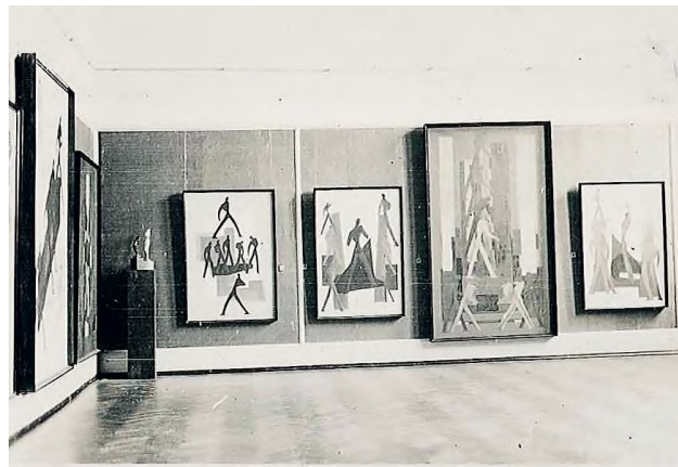
A brassói Redut kiállítóterem 1930-ban vagy 1933-ban Mattis Teutsch János kiállításával (a rendelkezésre álló források alapján egyelőre eldönthetetlen, hogy Mattis Teutsch 1930-as vagy 1933-as brassói kiállításakor készültek-e a fotók)

Az Artmagazin legutóbbi számában Boros Judit kollégánk foglalkozott az akkoriban nyílt, Kassák múzeumbeli Mattis Teutsch János-kiállítással (Boros Judit: Kilépés a konstrukciók világából – Mattis Teutsch János utolsó korszaka, és ami mögötte van. In: Artmagazin 120. 2020/1., 26–33. o.). A Mattis Teutsch – Avantgárd és konstruktív realizmus című kiállítás megpróbálja új megvilágításba helyezni Mattis Teutsch utolsó alkotói korszakának műveit, bizonyítani kívánva, hogy ezeket eddig méltánytalanul elhanyagolta a művészettörténet és a műkereskedelem, nem ismerve fel a bennük rejlő értékeket. A cikk első részében hangsúlyosan szerepel egy olyan eseménysor, amely a MissionArt Galériához köthető, miszerint a Galéria (természetesen az egyedüli örökös és jogtulajdonos, Mattis Teutsch Waldemár jóváhagyásával és beleegyezésével) restauratori beavatkozással letöröltette néhány, az 1950-es években átfestett festmény felső rétegét, hogy alóluk előkerüljenek az eredeti, 1928–1933 között festett művek. Ezt a cselekményt a szerző mélyen elítéli és sajnálja, hogy annak idején, 2013–14-ben sem ő, sem más nem szólalt fel a kései alkotások eltávolítása miatt, bár arról egy minden részletre kiterjedő beszámoló jelent