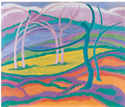
Mattis Teutsch János: Koratavas , 1917 körül, olaj, karton, 50 x 60 cm HUNGART © 2020

tatózó emberi figurák elkezdenek ön- álló léteket élni, sőt egyre inkább mint cse- lekvő ember mutatkoznak. A húszas évek legvégén nemcsak az elvont cse- lekvés, hanem maga a dolgozó ember lesz a művek fő témája, sőt a közös tevé- kenység néven nevezett célja, a munka.