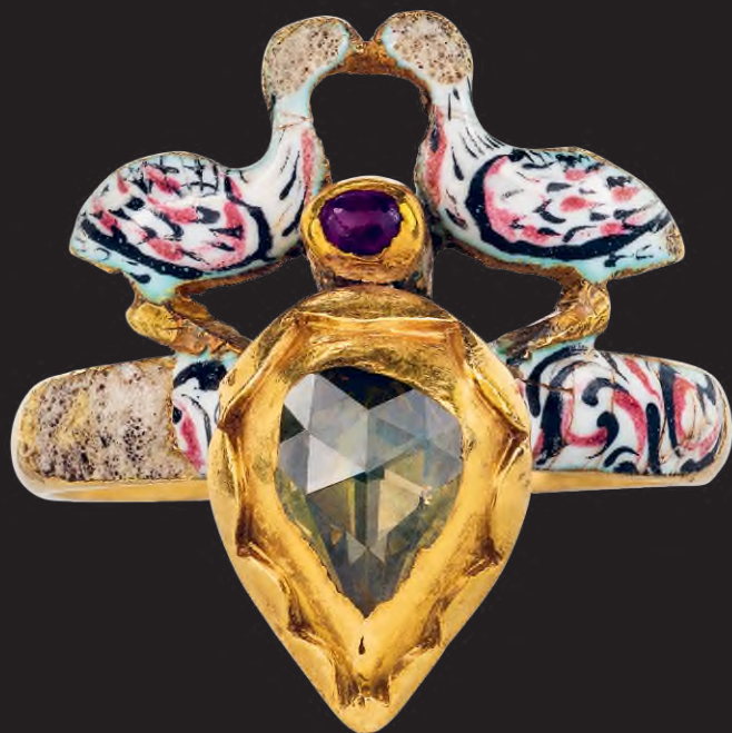
Női gyűrű, Németország, 1620 k., arany, gyémánt, rubin, zománc, 1,7 x 1,5 cm