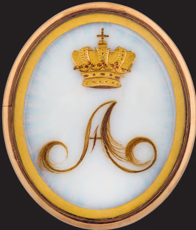
Emlékmedál I. Sándor cár monogramjával és hajtincsével. Az ékszertípus később, a viktoriánus korban vált igazán népszerűvé. Miers, London, 1825 k., arany, zománc, haj, papír, 5,2 x 4,4 cm