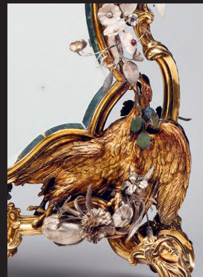
II. (Nagy) Katalin orosz cári jelképekkel diszitett tükkrét kifejezetten a Juwelen! kiállításra restaurálták, 1738–39, aranyozott ezüst, zománc, tükör, 82 x 51 cm