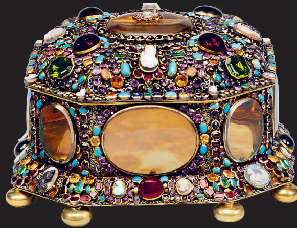
Ékszertartó doboz titkos rekesszel ellátva, Augsburg, Németország, 1680 k., arany, ezüst, rubin, smaragd, achát, hegyikristály, peridot, almandin, pirop, citrin, ametiszt, türkiz, jácint, topáz, zománc, 14,5 x 24,5 x 22,5 cm