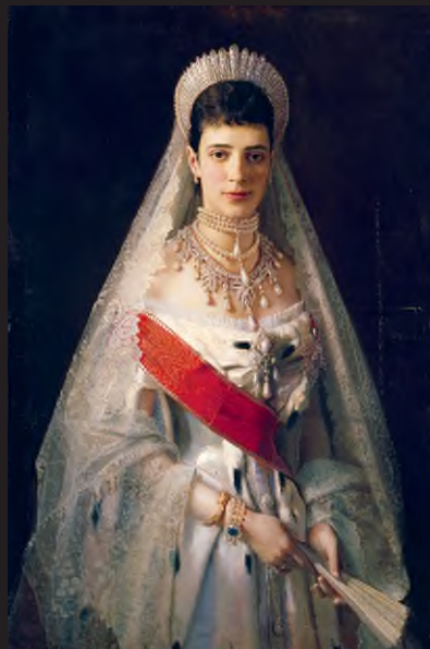
Ivan Nyikolajevics Kramszkoj: Marija Fjodorovna cárnő portréja , 1881, olaj, vászon, 109 x 74 cm

A dél-afrikai Blombos-barlangban 1997-ben egy körülbelül hetvenezer éves leletet tártak fel: közel azonos méretű és azonos helyen átfúrt folyami kagylóhéjak csoportját. A mikroszkopikus vizsgálatok során olyan kopásnyomokat találtak a kagylókon, amikből következtetni lehet arra, hogy azokat felfűzve hordták. Ez a kagylólánc tehát a ma ismert első ékszerek egyike, feltételezéseink szerint régebbi annál, mint hogy beszélni kezdtünk volna az evolúció során. Az ötvösművészet, miután saját gyerekkorán túljutott, alkalmassá vált az önkifejezésre, a közvetítésre, fejlődésében az európai dinasztiák jelenléte felbecsülhetetlen fontosságú volt. A fényűző életet kedvelő, hóbortjairól híres Marie Antoinette-et olyan gögös és felelőtlen uralkodóként tartja számon az emlékezet, aki szinte egy személyben felelős Franciaország pénzügyi válságáért. Az ellene felhozott vádakat enyhítheti, hogy az osztrák főhercegnő mindössze tizennégy évesen kötött házasságot Lajos Ágostonnal, majd 1774-ben, tizennyolc éves