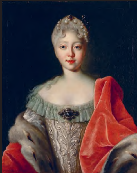
Louis Caravaque: I. Erzsébet cárnő portréja , 1720-as évek, olaj, vászon, 78 x 63 cm