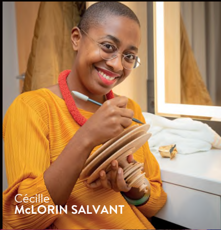
Cécille McLORIN SALVANT