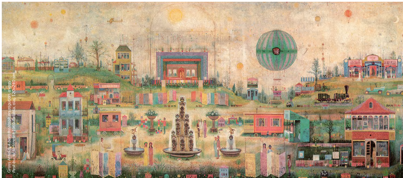
Gross Arnold: A barokk városok országán, a végy Pest-budai tereketek 1969. Fatábla, olaj, 120x240 cm