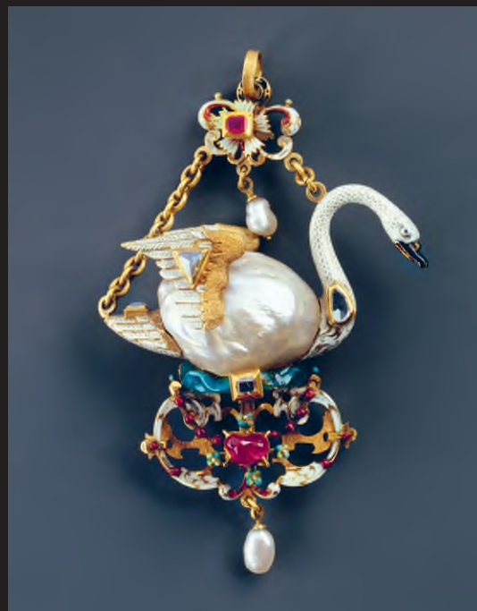
Hattyút ábrázoló medál, Hollandia, 1590 k., arany, rubin, gyémánt, gyöngy, zománc, 9,2 x 5,9 cm

alatt bekövetkezett változások folytonosságát, a kiállítás kronológia szerint rendszerezi az alkotásokat, az időszakon belül pedig további szekciókra osztja a gyűjteményt. A kurátorok külön állították ki az alkalmi és a hétköznapi darabokat, külön terembe kerültek a gyászékszerek és a szerelmiek, amelyek néha titkos üzenetek kézbesítésére is alkalmasak voltak.