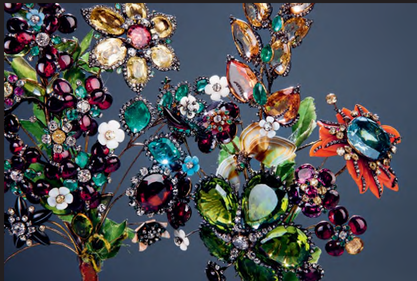
Jérémie Pauzié udvari ékszerész által készített virágcsokor kítűző, 1740-es évek, arany, ezüst, gyémánt, színes drágakövek, üveg, textil, 14 x 12,5 cm