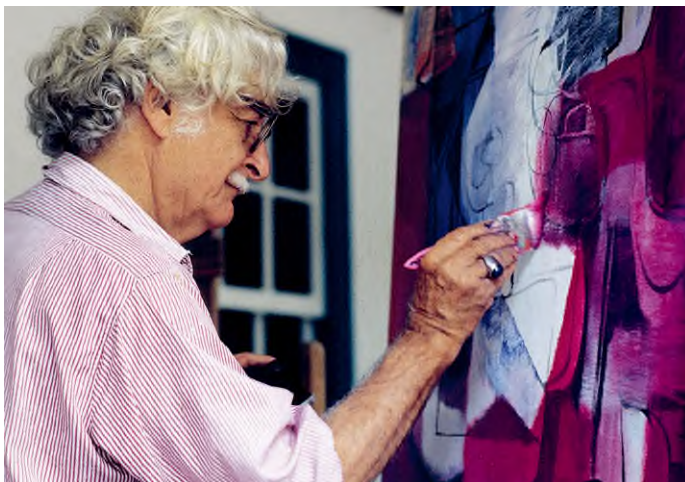
Roberto Burle Marx a műteremben, 1980-as évek

A botanika is gyerekkorától fogva érdekelte, édesanyja és dajkája is szenvedélyesen kertészkedett. Járatták a német képes újságokat, és a Gartenschönheit ideáljai szerint kertet terveztek, sőt odahaza új virágfajták létrehozásával is kísérleteztek. Későbbi interjúiban és előadásaiban Burle Marx sosem felejtette el megemlíteni, hogy tulajdonképpen Európában, a berlini üvegházakban ismerkedett meg a trópusi növényvilággal, ami teljesen lenyűgözte és meglepte. A brazil városok köztereit, parkjait ugyanis a gyarmati kultúra örökségeként a mindenkori európai divat szerint alakították, gyakorlatilag figyelmen kívül hagyva a vadnak és kezelhetetlennek tartott, az európai kertépítő sémákhoz nehezen adaptálható, ám fantasztikus gazdagságú trópusi növényválasztékot. Burle Marx modern kertjeinek, közparkjainak később egyik forradalmi újítása lett az őshonos növények alkalmazása, illetve az az absztrakt struktúra, amit a modern európai építészetben és az új festészeti irányzatokban a legizgalmasabbnak talált. Dél-Amerikába visszatérve először mégis inkább a riói képzőművészeti főiskolára jelentkezett, ahol építészetet, és professzora, Lucio Costa tanácsára festészetet is tanult. A zenei karrier hát-