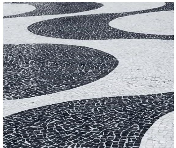
A riói Copacabana tengerparti promenádjának Burle Marx által tervezett geometrikus mintázatú köborítása