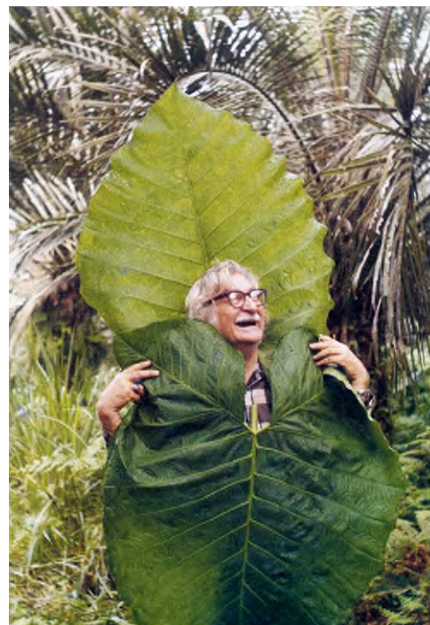
Balra a Sítio egyik romjaiból feltámasztott épülete a dzsungelszerű növényzetben, Rio de Janeiróban. Jobbra Roberto Burle Marx egy ecuadori botanikai expedíció 1974-ben