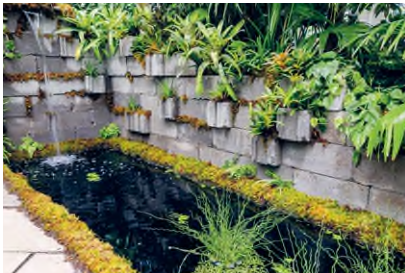
Trópusi növények függőkertje medencével az úgynevezett Felfedezők kertjéből, New York Botanical Garden