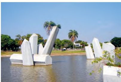
A Hadügyminisztérium háromszög alakú kertrendszere, amit a víztükrökből kimeredő hatalmas betoninstallációkról neveztek el Kristály térnek

absztrakt beton falplasztika, amelynek színes mintázata a lépcsőzetesen elhelyezett medencékben tükröződik.