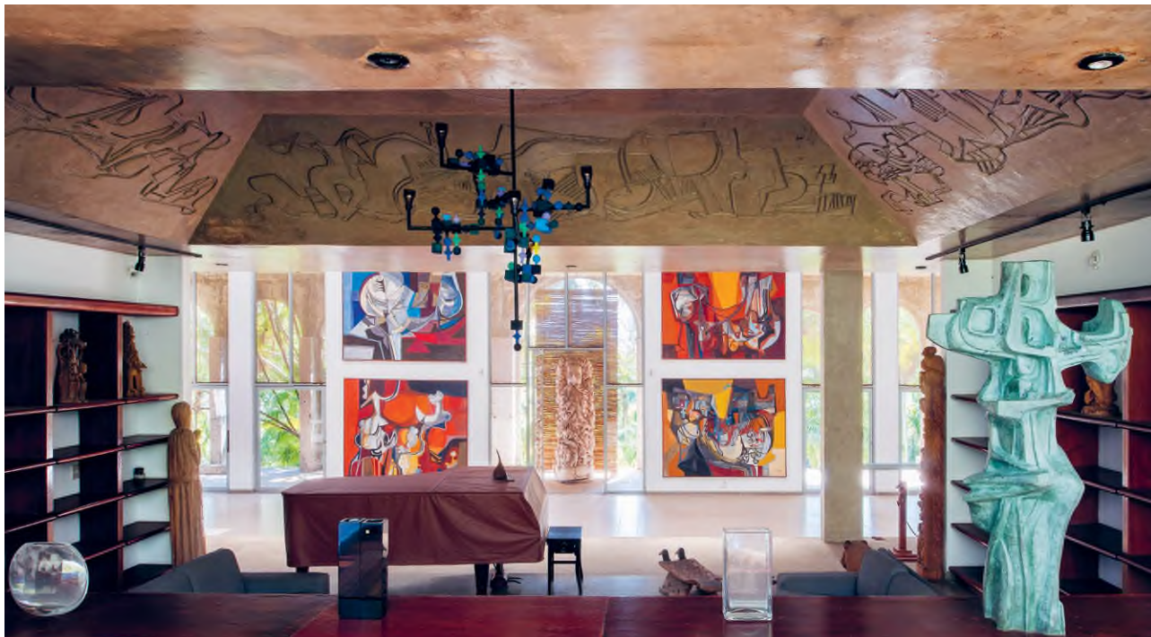
A Sítio belső tereiben néprajzi és műgyűjteménye mellett Burle Marx saját festményei, plasztikái is helyet kaptak. A muráliákat, mozaikokat, sőt a világítótesteket is maga tervezte, Sítio Burle Marx, Rio de Janeiro