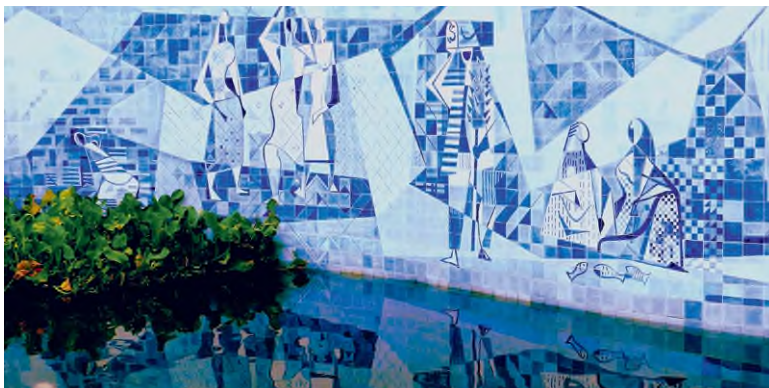
Burle Marx mozaikja az Instituto Moreira Salles vízikertjébe készült

A Sítio Santo Antônio da Bica lett az otthona, műterme, faiskolájának telephelye. Szépen rendbe hozott gyarmati stílusú épületegyüttese és látványosan romantikus kertfűzére évtizedek alatt organikusan fejlődött. A dzsungelszerűen buja növényzet érdekes kontrasztot alkot a bontott épületek gránitredékeiből és öntött beton elemekből szerkesztett modern falplasztikákkal. Itt kísérletezte ki azokat a kerti installációs elemeket is, amelyek az ötvenes években – amikor számos magánkert mellett megbízásokat kapott több közpark kialakítására – elkészült munkáiban is rendre feltűnnek. Régi barátjával, Mello Barretóval együtt tervezték a riói állatkert környezetét, Sao Paulóban pedig a riói minisztériumépület után újra Oscar Niemeyerrel dolgozott együtt. A város fennállásának 400. évfordulójára készült el a hatalmas kiterjedésű vízfelületekkel tagolt tájkert, Sao Paulo első nyilvános parkja. Sajnos az ágyások fölött kanyargó emelt sétányok nem épültek meg, de a terv így is lenyűgözően nagyvonalú. Ötvenes évekbeli stílusát leghívebben egy szintén Sao Paoló-i kert, az egykori Francisco Pignatari-rezidencia (1956) képviseli. A ma már az ő nevét viselő Parque Burle Marx jellegzetes elemei a magasra nyúló pálmafasor a sakktáblamintásra nyírt gyeppel (aminek a titka a kétféle színű és textúrájú fűfajta) és az a geometrikus