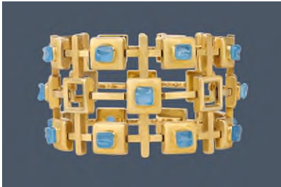
Roberto and Haroldo Burle Marx: Egyedi csiszolású, (Forma Livre) akvamarin és tizennyolc karátos arany karkötő, 1965 k.