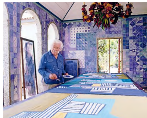
Roberto Burle Marx a Sítio szabadtéri műtermében dolgozik, 1980-as évek