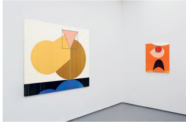
Enteriőr Batykó Róbert Vörös szem című kiállításáról, 2019, acb Galéria