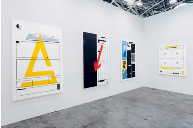
Enteriőr Tót Endre Layout festmények 1988–1991 című kiállításáról, 2019, acb Galéria