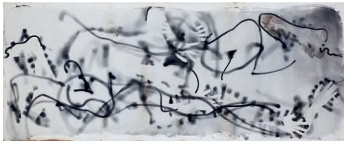
Eperjesi Ágnes: Kúszás I. , 1988, fotogram, 254 x 101 cm