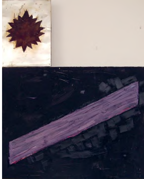
Szarka Péter: Cím nélkül , 1987, vegyes technika, 80,5 x 60 cm és 135 x 170 cm

az acb Galéria jóvoltából / HUNGART © 2019