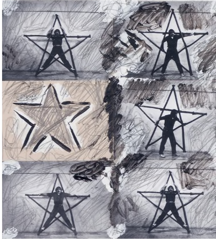
Pinczehelyi Sándor: Csillagcipelés (S) II. , 1989, zselatinos ezüst nagyítás, akril, ceruza, 70 x 100 cm

Az a tudásbéli hiány, ami a szakmát a Pécsi Műhellyel kapcsolatban jellemzi, és az ebből fakadó mellőzöttség nagyrészt a vidékiségükkel volt kapcsolatba hozható.