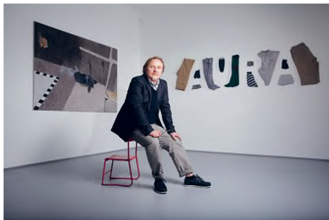
Pados Gábor © acb Galéria