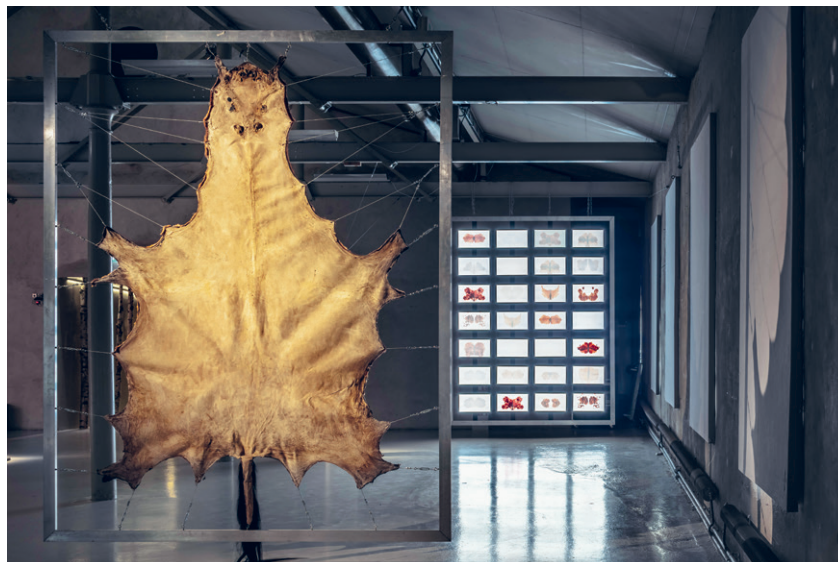
Signe Johanessen Bloodlines 1 és Protector című munkái a Children of the Children of the Revolution című kiállításon