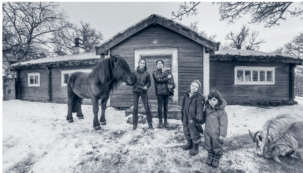
Részlet Nikolina Ställborn Time Loop: Grälle 1946, Pälle 1976, Arw 2018 című munkájából © Nikolina Ställborn

Ezeknél jóval hűvösebb művek kerültek be a kiállítás anyagába Lina Selander (1974) munkásságából. A When the Sun Sets It's All Red, Then It Disappears ( Amikor a nap lenyugszik, minden piros lesz, majd eltűnik , 2008) című videoinstalláció Jean-Luc Godard A kínai lány (1967) című filmjén alapszik, amely Párizsban egy polgári lakásban játszódik, ahol öten – három fiú és két lány – marxista-leninista, maoista életelveiket taglalják. Selander munkája címét is a filmből emelte ki. Az eredeti helyen a marxizmus-leninizmus definíciója gyanánt mondja egyikőjük, azzal a kiegészítéssel: „ But in my heart the sun never sets ” („ De az én szívemben sosem nyugszik le a nap ”). Az installáció elemei a filmből, az 1968-as párizsi és stockholmi diáklázadásról készült