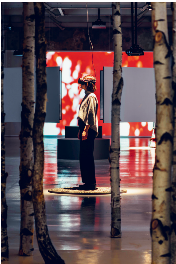
Egy látogató Nikolina Stållborn Time Loop: Grålle 1946, Pålle 1976, Arw 2018 című munkáját nézi a Färgfabrikenben