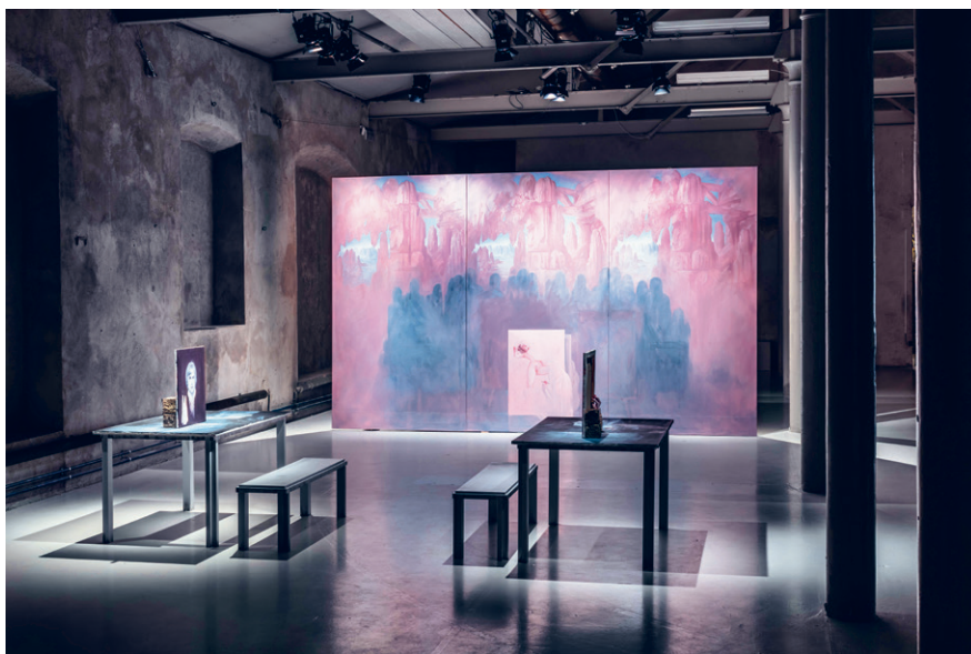
Kiállítási enteriőr Ylva Snöfrid festményinstallációjával

a szabad szerelem és a személyes problémák színjátékon keresztüli feldolgozásának elvein alapuló, Otto Muehl-féle Aktionsanalytische Organisation mozgalomból inspirálódott, amellyel egy másik munkájában külön is foglalkozik Lombard. A videoinstallációban megjelenő történetek között található az egymás előtt fürdés zavaró élménye, valamint egy,