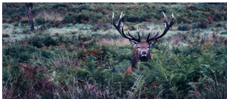
Állókép Signe Johanessen The Stag (2018) című videomunkájából