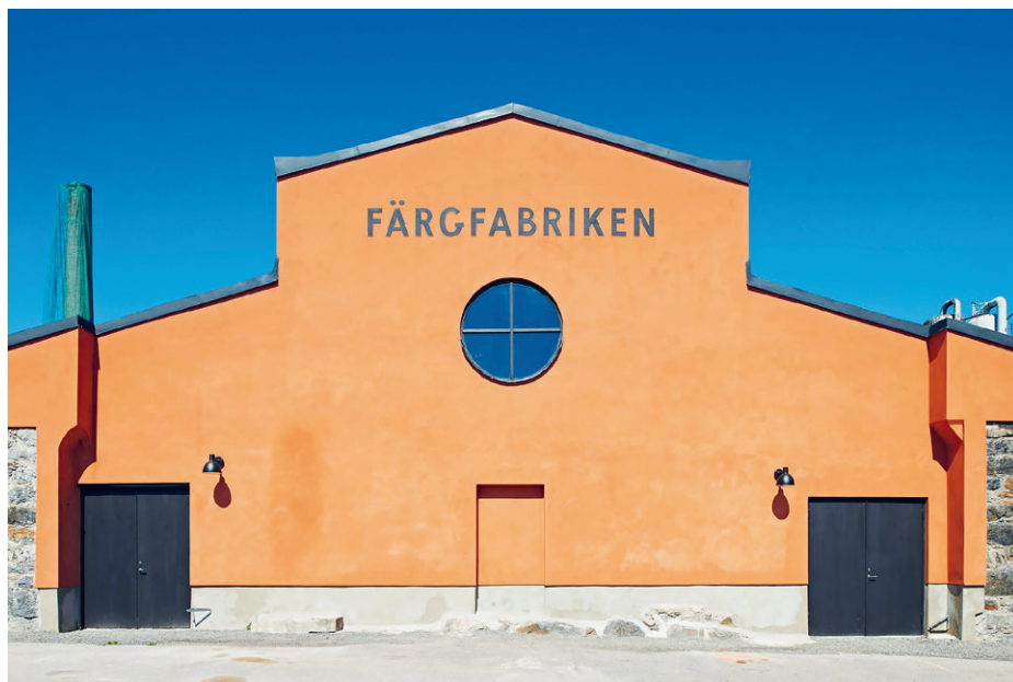
A Färgfabriken homlokzata.

A Färgfabrikent 1889-ben építtette Helge Palmcrantz, svéd feltaláló és iparmágnás. Palmcrantz az 1870-es években új aratógépeket, fűnyírókat és géppuskát tervezett, de 1902-ben már a ma Becker néven futó festékgyártó cég kezdte meg a termelést az épületben: szappant, művészeti kellékeket és ruhaanyagokat is gyártottak. Az 1970-es évektől már csak néhány raktárhelyiség maradt használatban. 1995-ben nyílt meg a Färgfabriken első kiállítása.