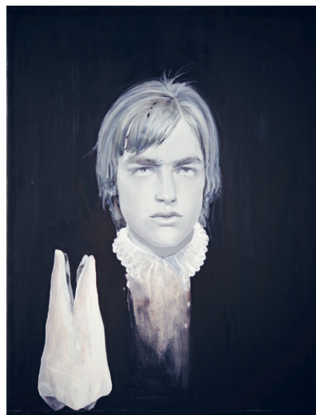
Részlet Ylva Snöfrid Father Paris 1967 with Wisdom Tooth and Mirrored Wisdom Tooth (2016–2017) című diptichonjából