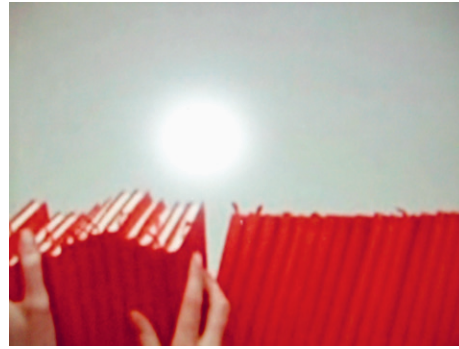
Állóképek Lina Selander When the Sun Sets It's All Red, Then It Disappears (2018) című videoinstallációjából