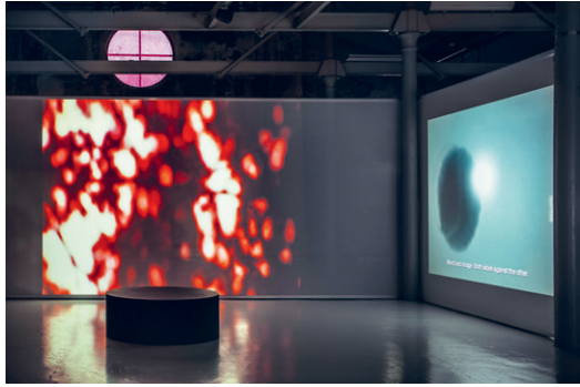
Lina Selander: When the Sun Sets It's All Red, Then It Disappears , 2018, videoinstalláció