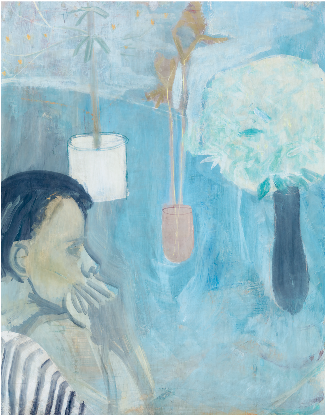
Mattioni Eszter: Emlékezés , 1930-as évek, tempera, falemez, 90 x 73 cm