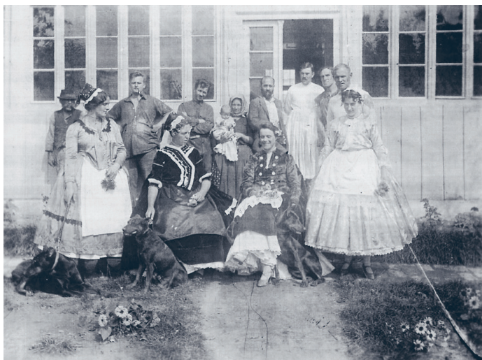
Művésztársaság Igalon, 1927