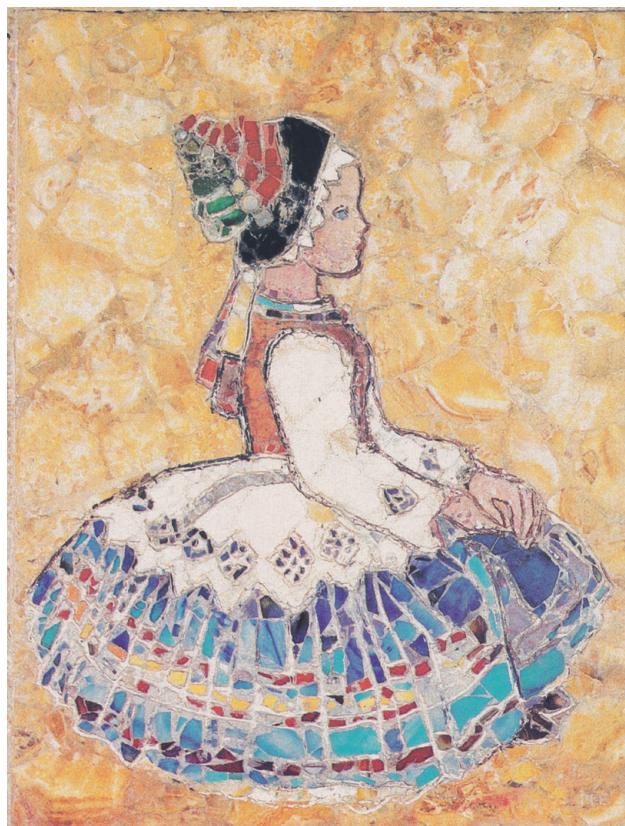
Mattioni Eszter: Sióagárdi ülő kislány , 1970, hímeskő