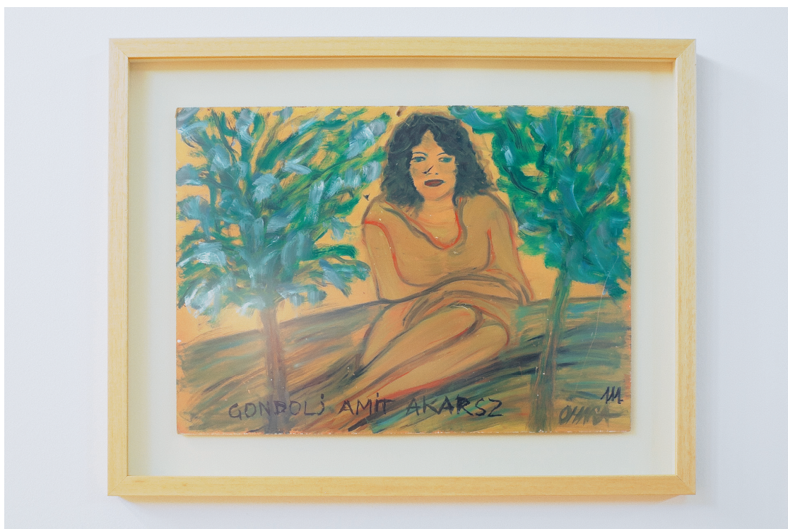
Omara: Gondolj, amit akarsz!

megfigyelőként voltam jelen, néztem, hogy dolgoznak a többiek és képeztem magam.