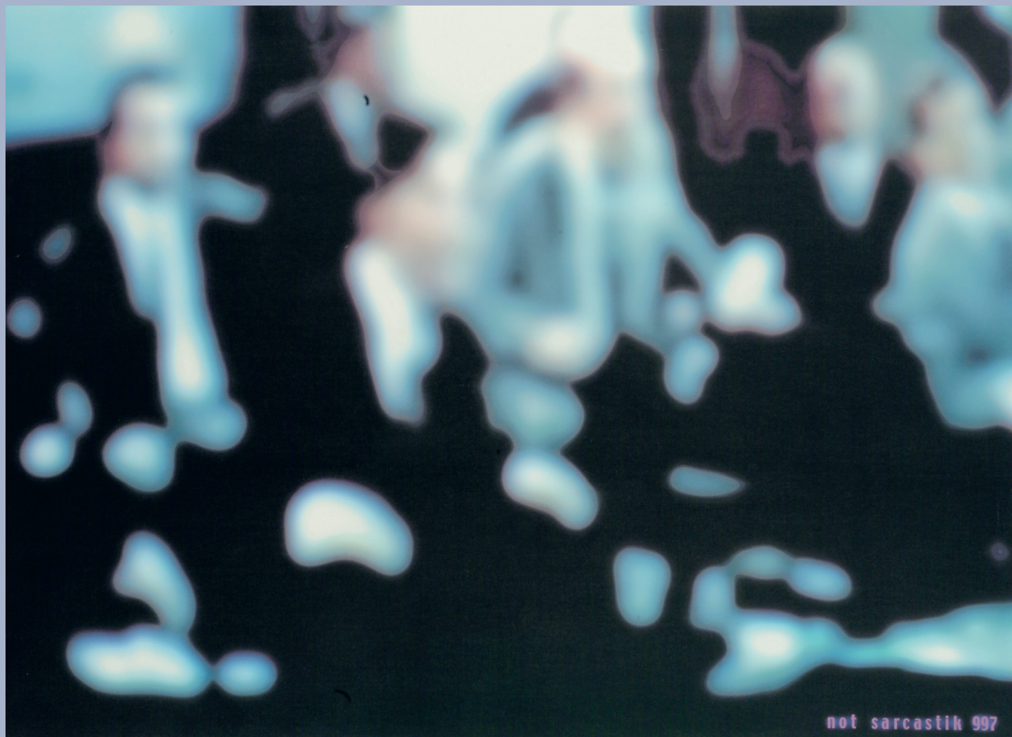
Szarka Péter: Contemporary, 1997-99, Ludwig Múzeum – Kortárs Művészeti Múzeum