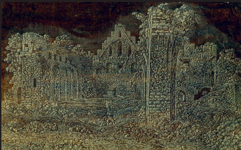
Hercules Segers (1590 k. – 1638 k.): A Rijnsburgi kolostor romjai délről , 1625–30 k., rézkarc, sárgásfehér festékkel sötétbarna alpra nyomva, 20 x 31,9 cm, Kupferstichkabinet. Staatliche Museen zu Berlin

Életéről néhány adat maradt csak fenn, pedig a holland aranykor híres és nagyon népszerű festő-rézmetezője volt Hercules Segers. Rembrandt nyolc munkáját vette meg saját gyűjteményébe, köztük a hagyatékból egy rézlemez is, amit később átdolgozott és Segers mesteri tájképét többé-kevésbé érintetlenül hagyva, saját neve alatt „forgalmazott”. Segers tájképfestőnek tanult, de szelmalmokkal tarkított józan holland mélyföld helyett misztikus tájakat, sziklaszirtekkel és szakadékokkal szabdalta (általa egyébként sosem látott) hegyvidéket festett, néha saját amszterdami városi házát ágyazva bele a fantasztikus panorámaképekbe. Festményeiből mára alig több mint egy tucatot tartanak számon, metszete viszont annál több maradt, köztük egészen különleges darabok is. Kortársaival ellentétben őt nem az érdekelte, hogy a nyomatok mindig tökéletesen egyformák és főként hogy fekete-fehérek legyenek. Kísérletezett színes tintával és előre színezett alappal is: világos tintával sötét alpra nyomott kolostorromjai például kísérteties éjszakai táj hatását keltik. Gyakran nem is papírra, hanem lenvászonra nyomtatott, aztán a nyomatot tovább színezte, festette, vagy szétvágta és miniatűr festményt készített belőle. A műfaji határok összemosásának avantgárd gesztusa miatt nehéz eldönteni, hogy nyomtatott festményekről vagy inkább festett nyomatokról van szó. Hirtelen halála lehetett az oka, hogy olyan sok félbemaradt, de ma is hihetetlenül izgalmas kísérleti darabot hagyott hátra.