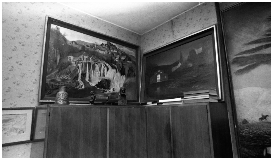
Budapest V. kerület, Galamb u. 3., Gerlóczy Gedeon építész lakása, Csontváry Kosztka Tivadar festményeivel: Vihar a Hortobágyon (1903) és Sétalovaglás a tengerparton (1909), 1975