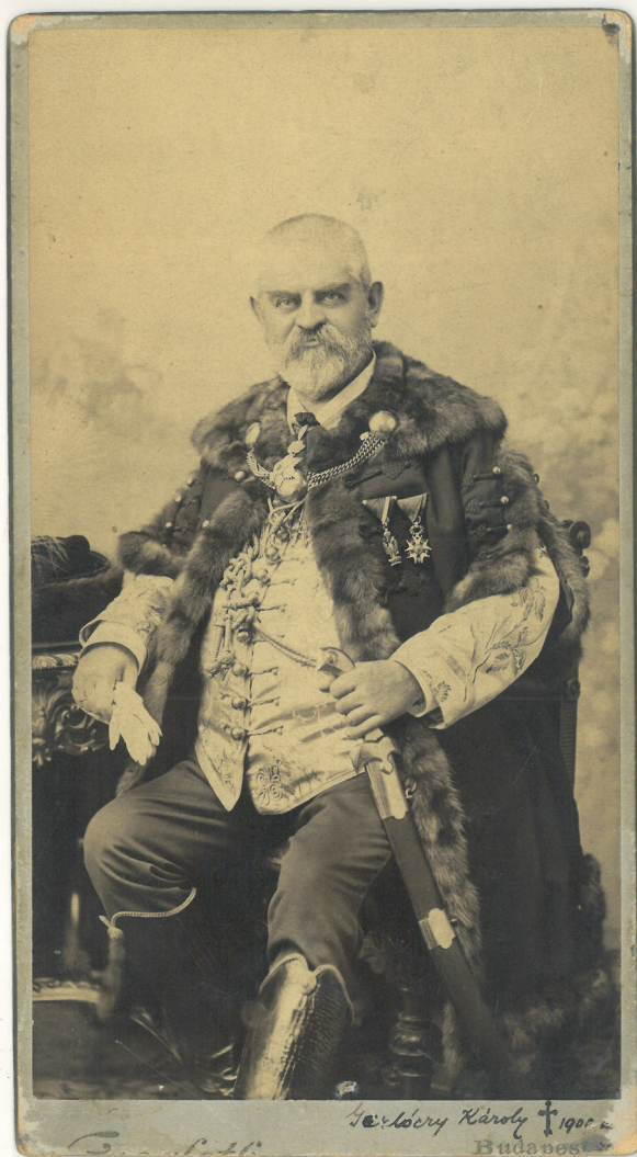
Gerlóczy Károly (1835–1900) az egyesített Budapest első alpolgármestere