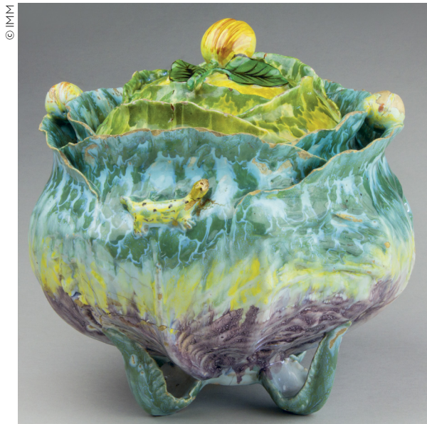
Káposzta alakú levesestál, Holicsi fajanszmanufaktúra, 18. század második fele, Iparművészeti Múzeum, ltsz. 52.269.1-2