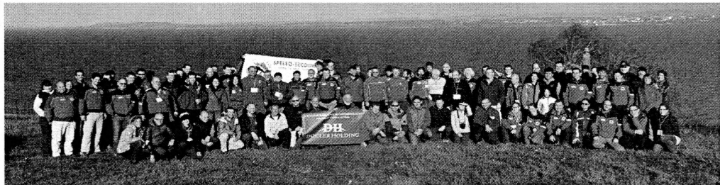
A rendezvény résztvevői

Összességében egy svájci pontosságához viszonyítva rugalmasan szervezett, tartalmas rendezvény emlékeivel lettünk gazdagabbak.