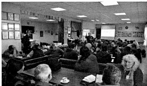
Előadás a találkozón

Előadás keretében és egy barlangban a gyakorlatban is bemutatásra került a Nicola III barlangi kommunikációs eszköz. Ehhez egy mintegy 1 órányi autóútra lévő barlangot kerestünk fel. A bemutatót Pete Allwright tartotta a résztvevők közreműködésével. Tapasztalatként megállapítható, hogy a rádió csak bizonyos körülmények között működik és bár a rádió működött, üzembiztonsága nem kielégítő, holott a megbízhatóság alapvető követelmény egy mentésnél. Mindezek mellett a tokozása, a csatlakozási pontok védelme sem megfelelő. Ennek ellenére a fejlesztői úgy gondolják, hogy 2017 első félévében kereskedelmi forgalomba tudják hozni.