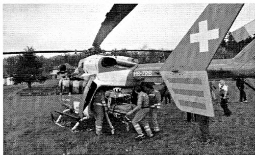
REGA légimentő szolgálat helikoptere

A Konferenciához kapcsolódó kirándulás egyik állomása a Col du Roches barlangi malom múzeum volt. Itt 1660–1898 között malom működött, amely a barlangon átfolyó Bied-folyó vizének energiáját használta a malomkerekek meghajtására. A helyszínt 1898-ban vágóhíddá alakították és a barlangban tüntették el a vágóhídi hulladékot egészen 1966-ig. 1973-ban barlangászok vállalták a barlang megtisztítását és a malmok részleges helyreállítását. Ez a munka 15 évet vett igénybe és a barlang azóta múzeumként működik.