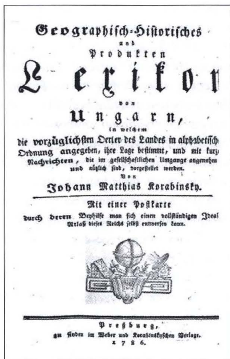
1. ábra. Vályi és Korabinsky lexikonjának címlapja