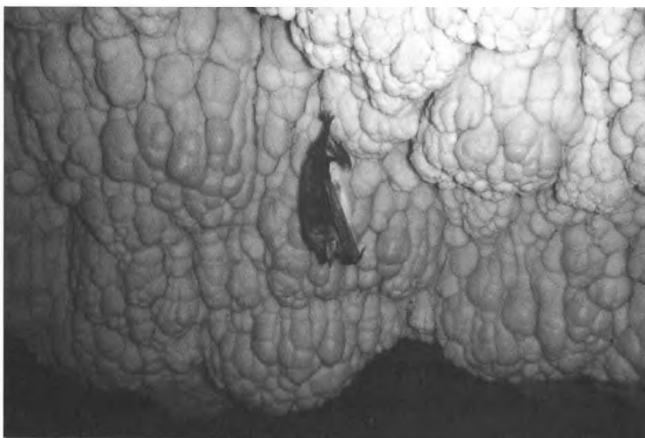
Barlanglakó (Ariadne-barlangrendszer, Legény-barlang, Denevér-ág)

és szélesre tárult. Tovább lefelé teljes szélességben tetarátágatok borították az aljzatot. Meztláb óvakodtam lefelé a vizes gátrendszeren, míg egy fehér falú nagyobb terembe értem. Nem hittem el, hogy a Pilisben vagyok, hiszen 16 méteres hosszával és 8 méteres szintkülönbségével megtaláltuk Magyarország legnagyobb tufagátját. A vízzel telt medencék gyönyörűen csillogtak a lámpafényben, a narancsszínű lefolyás pedig csodálatos látványt nyújtott. Egy kürtőből hallottam a többiek hangját felettem. Ott azonban nem lehetett lemászni, így tovább mentem előre, mert úgy gondoltam, lehet, hogy az alsó és felső járat arra összecsatlakozik. Újra fel kellett venni az eddig kezemben hozott csizmámat, mert agyagos aljzatú részre értem. Lefelé egy cseppköves falú gödörbe vezetett be a mésztufagát, de azzal most nem foglalkoztam. Tovább előre újabb nagy terembe másztam fel. Itt is nagy guanókupacok voltak. Mivel az állva járható szelvény itt véget ért, és a többiek hangját sem hallottam már, innen visszafordultam.