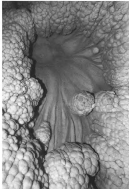
Ariadne-barlangrendszer, Legény-barlang, Denevér-ág.

Újabb elágazás következett. Balra rövid folyosórész után meredek falú gödörbe láttunk le. Alján cseppkőmedence volt. Óvatosan csak én másztam le, hogy ha nem megy tovább, feleslegesen ne koszoljuk össze a járatot. Öt méterrel lejjebb a járat elkanyarodott