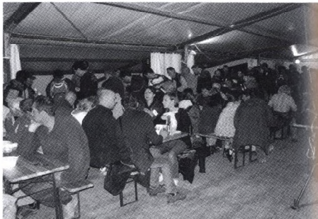
Gulyásparty a Pál-völgyi kőfejtőben

A Pál-völgyi kőfejtőben felállított egyik sátorban rendezkedtek be a felszerelést árusító cégek: a Meander, a Ponor, a Scursion és a Vertical Aventure. A legnagyobb érdeklődést kiváltó scursion lámpák mind tudásukkal, mind borsos árakkal mindenkit ámulatba ejtettek.