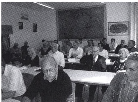
A Közgyűlés hallgatósága

A három elmaradt napirendi pont (2009. évről szóló közhasznúsági jelentés beszámoló, Felügyelő bizottság jelentése a 2009. évről és a 2010. évi költségvetés) tárgyalására és elfogadására a 2010. május 27-én 17 órára összehívandó küldöttközgyűlésen az ELTE Koch termében kerül sor. A küldöttközgyűlésen a korábban megválasztott küldöttek szavazhatnak.