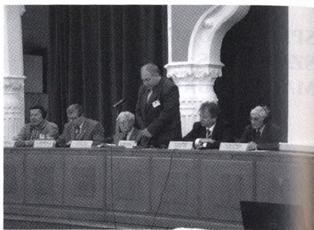
A rendezvény megnyitása a MÁFI Dísz-termében