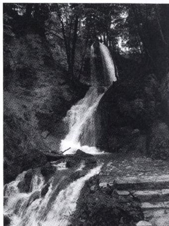
A lillafüredi vizesés ritkán látható vízhozama