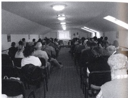
Az előadások helyszíne

A rendezvény keretében 28 előadás és vetítés hangzott el, illetve került bemutatásra, nem a megszokott bontásban. Tekintettel a 2010-ben bekövetkezett súlyos barlangi árvizekre, valamint a kolontári vörösiszap katasztrófára, a Szakmai Napok programjában is helyet kapott egy árvizes, illetve katasztrófa szekció. A szombati program végén először a másnapi Mala alagút meglátogatásához kedvet csináló filmbemutatóra került sor, majd a már lassan hagyománnyá váló zsiroskenyér party után Egri Csaba folytatta az előző napi 3D filmek bemutatását.