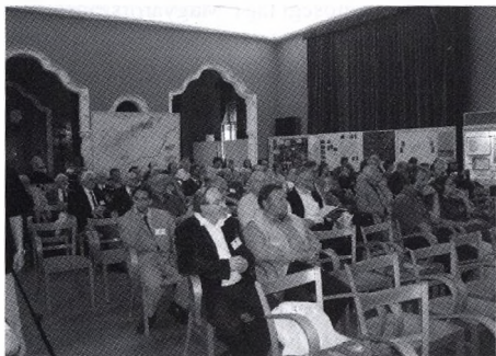
Az előadások közönsége