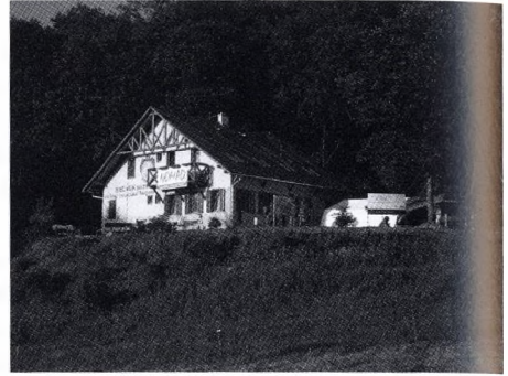
A Barlangnap központja, a Mecsek Háza

Az 54. Barlangnap megrendezésére Orfűn került sor, 2010. június 18–20-án. A Barlangnap a Mecseki Barlangkutató Csoportok és a Magyar Karszt- és Barlangkutató Társulat közös rendezvénye volt, melyen összesen 260 fő regisztráltatta magát. A rendezvény idején összesen 12 barlangban került sor túrákra, az indított 49 túrán összesen 334 fő vett részt (azaz átlagosan mindenki eljutott minimum 1 barlangba). A kiépített barlangok közül a Nagyharsányi-, az Abaligeti- és a Tettyei-mésztufabarlangban, a nem kiépített barlangok vagy barlangszakaszok közül a Vízfő-, Trió-, Spirál-, Maszek-, Mészégető-, Abaligeti- (Nyugati 2. oldalág), Gilisztás-, Szajha-Barlangokban és a Büdöskúti-, valamint a Kőteles-zsombolyokban voltak túrák. A túrák vezetésében a Mecseki Karsztkutató Csoport, a Pro Natura Karszt- és Barlangkutató Egyesület, valamint a Szegedi Karszt- és Barlangkutató Egyesület túra-vezetői vettek részt.