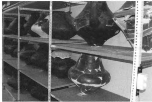
A Természettudományi Múzeum gazdag leletanyagának kis részlete a raktárakban

A konferencia idejére Társulatunk megjelentette a 2006. évi – Budapesten rendezett – 8. ALCADI szimpózium előadásait tartalmazó kötetet, melyet a helyszínen át is adtunk a jelenlévő akkori résztvevőknek, a jelen nem lévők ezt követően postán kapták meg.