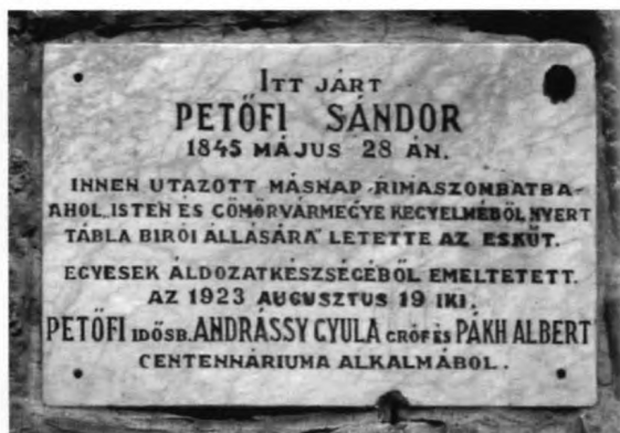
5. kép. Az aggteleki sziklafalon ma is megtalálható, Petőfi látogatásának emlékét őrző emléktábla

Az ünnepség után a vendégek, „a sajtó képviselői, a rajzoló és fényképészek”, csoportok-