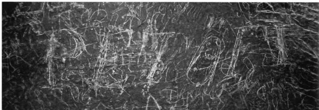
3. kép. Az eredetinek vélt Petőfi felirat a Baradla falán