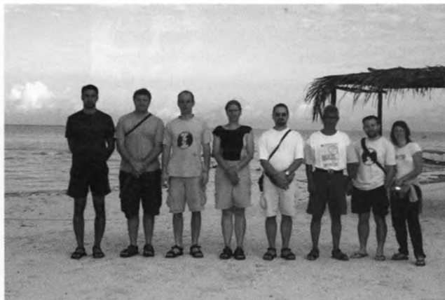
A megvalósult álm résztvevői

A főváros (tfm. 2240 m) a Dél- és Közép-Amerikára oly jellemzően zsúfolt, zajos és mocskos, hogy első benyomásainkat a repülőből kiszállva, a hirtelen magasság ellenére sem tudtuk kótyagos fejünkből kiverni. Iszonyatos tömegáradat mindenhol, az emberek zajosan, hangosan élnek, egy részük szó szerint az utcán, a másik részük pedig a városok körüli nyomornegyedekben, a szerencsésebbek pedig normál körülmények között a városban. Maga a város egyébként Hernan Cortes-nek köszönheti létét, mert az aztékok (mexikák) által alapított Tenochtitlán 1521-es elpusztítását követően alapították. Ez egykori főváros romjai a mai napig megtekinthetők a főtér (Zócalo) mellett. Ennek a romnak a megtekintésével, valamint a spanyolok által a romokra emelt katolikus katedrális meglátogatásával kezd-