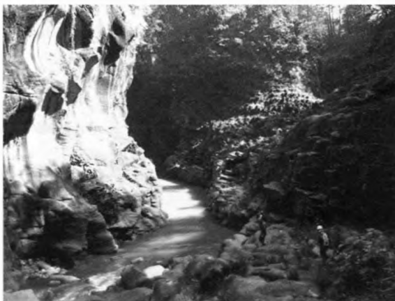
Az El Solitero-kanyonban

A kis kórházi kényszerpihenőnk alatt, míg mi a mexikói nővérkével ismerkedtünk, a többiek az El Solitero-kanyont járták be.