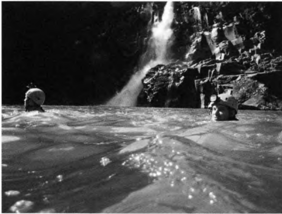
Az El Solitero-kanyonban

Kiszállásunk brutálisan meredek vízmosás, kapaszkodunk a növényzetbe, tépjük a páfrányokat, itthoni dísznövények tömkelegét. A főút előtti kis veteményeskertből kértünk némi ennivalót, amit magunk szedünk és vágunk: citromot (az eredeti sokkal savanyúbb), cukornádat, azt rágjuk. Mindenki feltankol cukornád rudakkal, pruszik zsinórunkból állnak ki, mintha török lennének. A kávészedő helyiek ki is röhögnek rendszeren.