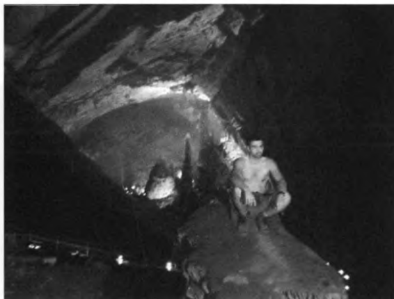
A Grutas del Cacahuamilpa

A Toluca környéki kis kiterők után végre lehetőségünk nyílt igazi szenvedélyünknek, a barlangászatnak élni, hiszen elmentünk a Középmexikó egyik legszebb természeti és turisztikai