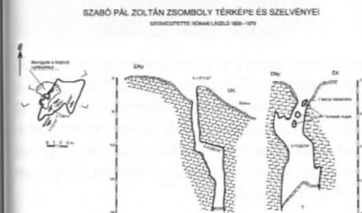
3. ábra. A Szabó Pál Zoltán-zsomboly térképe és szelvényei

A Keszthelyi Televízió 2002-ben a barlangról forgatott ismeretterjesztő filmjéből tudjuk, hogy a barlangkutatók éppen e teremből mélyítik az alsó járatok feltárását célzó kutató aknát.