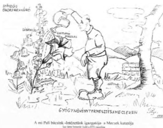
1. ábra. Szabó Pál Zoltán a Mecsek kutatója (Szinetár Judit karikatúrája)

Szabó Pál Zoltán életútja, — társadalomföldrajzi munkássága, — karsztmorfológiai kutatásai, — szerepe a Mecsek és a Villányi-hegység karszthidrologiai kutatásaiban, — szerepe a délkelet-dunántúli barlangkutatásban, — felszínfejlődési kutatásainak főbb eredményei, — munkásságának társadalmi jelentősége, — megemlékezés születésének 100. évfordulóján a pécsi temetőben, — Szabó Pál Zoltán tudományos publikációi.