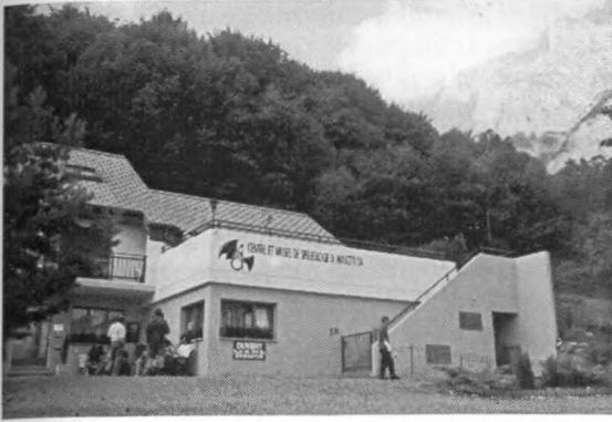
A barlangmúzeum épülete Chamosonban

Természetesen részt vettünk a kongresszus hivatalos programjain is, de mindezek mellett jutott még idő két idegenforgalmi barlangra is. Az első a francia határ közelében nyíló Grotte Réclére volt. A barlang egyetlen hatalmas teremből áll, melyben nagyon szép, impozáns cseppkőképződmények találhatók. A barlangtúra után a látogatók egy másik látványosságban gyönyörködhetnek, még hozzá a felszínen berendezett prehisztórikus parkban. Itt életnagyságú műanyag dinoszaurosok és egyéb félelmetes őslények bukkannak elő a fák közül, sőt az erdőben megbújó kis tónál még a Loch Ness-i szörnyel is találkozhatunk.